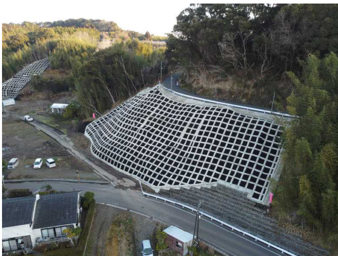
急傾斜事業 今別府－1地区(新富町)

土石流やがけ崩れによる土砂災害から県民の生命、財産を守るため、砂防ダムや急傾斜地崩壊防止施設の整備を進めます。