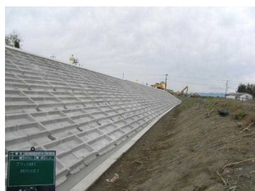
①コンクリートブロックによる護岸工施工