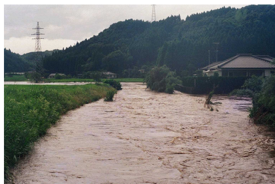
出水の状況（宮田川）