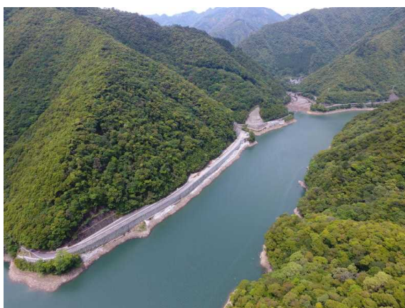
(東郷西都線 松尾工区 施工中)

児湯地域と西都や県北入郷地域とをつなぎ、災害時の救急・救命活動をささえる緊急輸送道路の整備を進めています。