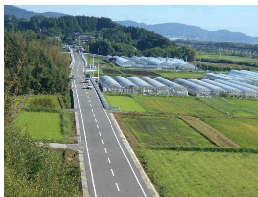
(高鍋美々津線 東都農工区 H29完成)