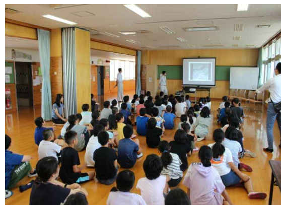
土砂災害防止教室