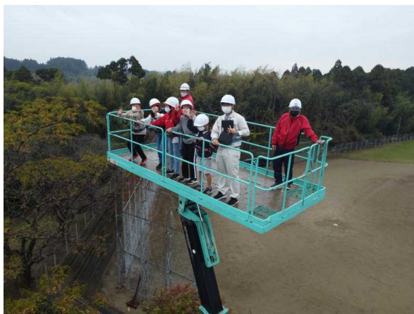
土木の日・出前講座

毎年11月18日前後に「土木の日」イベントとして様々な取組を行っています。小学生を対象とした出前講座及び建設機械や測量機器等の各種ふれあい体験を建設業協会等の関係団体と協働して実施し、花の苗植えなど、各種PR活動も併せて実施しております。