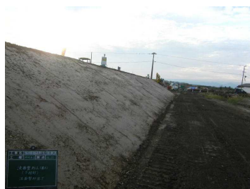
②ブロックの上に覆土を施工