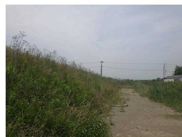
③工事完成後1年3ヶ月後