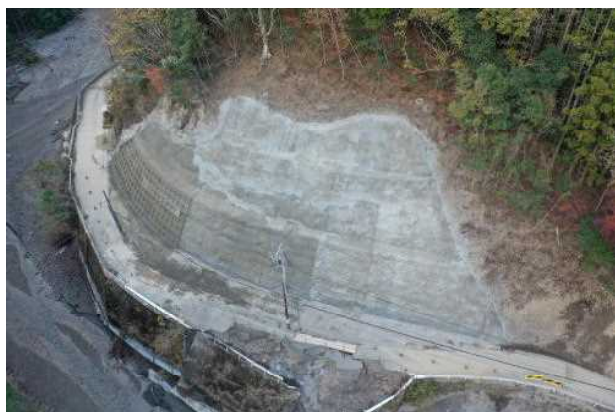
国道388号中山工区 (美郷町南郷鬼神野)

令和4年9月に襲来した台風14号により管内の国県道においても道路決壊や法面崩壊が発生した。応急復旧工事の速やかな実施や、国の権限代行事業による仮橋設置等の取組を行うことで、通行止め箇所の早期解消や崩壊箇所の速やかな復旧に取り組んでいる。