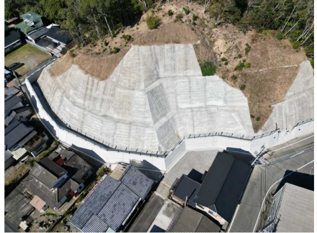
門川町 梅の木地区 施工状況