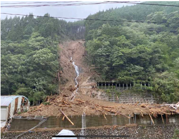
椎葉村 鹿野遊谷川 被災状況(R2.9.7)

令和2年9月の台風10号により椎葉村鹿野遊地区で発生した土砂災害について、災害関連事業（R2採択）で設置する砂防堰堤とあわせて斜面对策を実施し、今後の土砂災害を防止します。