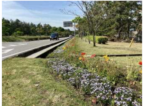
県民との協働による花の植栽 【県道日知屋財光寺線】