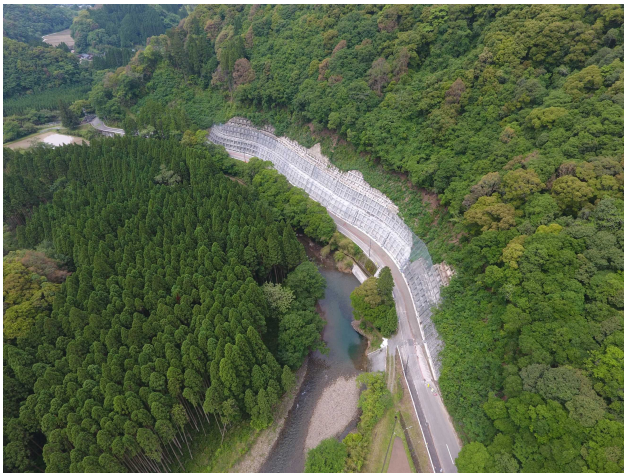
八重原延岡線 阿仙原2工区

国道へのアクセスや指定避難所への避難ルート、当該エリアにおける幹線道路的機能等、それぞれの地域で求められる道路の機能に応じて、1.5車線の道路整備手法を交えながら道路改良を進めている。