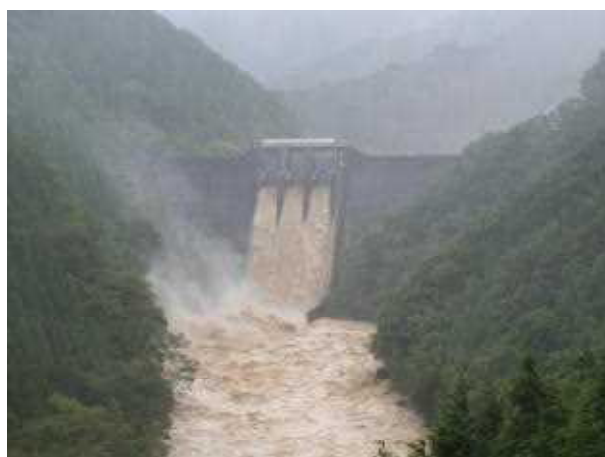
放流時の渡川ダム