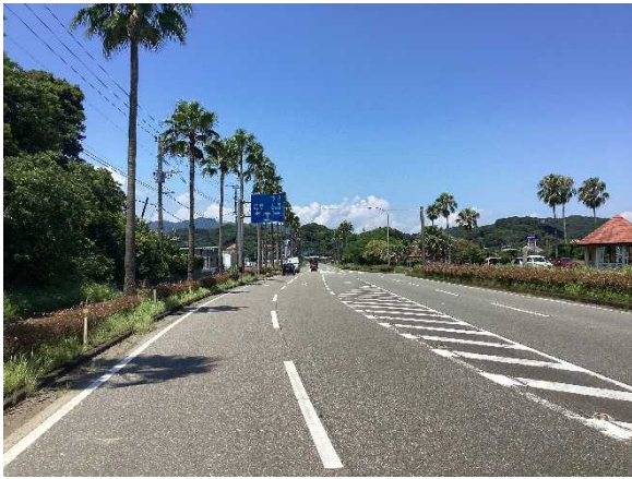
沿道修景植栽地区の再整備 【県道日知屋財光寺線】

平成29年4月に施行された「美しい宮崎づくり推進条例」に基づき、県土の美化を推進するため、沿道修景美化推進路線におけるリニューアル整備や沿道修景植栽地区の適正な維持管理、国道327号における眺望回復の取り組みのほか、県民との協働による花木植栽を行っている。