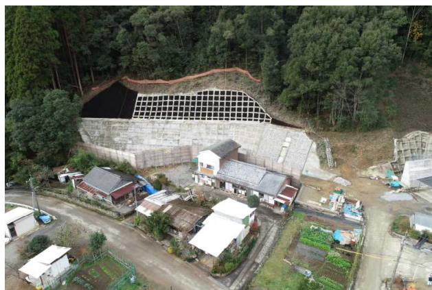
美郷町西郷 上八峡地区 施工状況