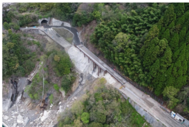
国道327号 松の平工区 (諸塚村家代)