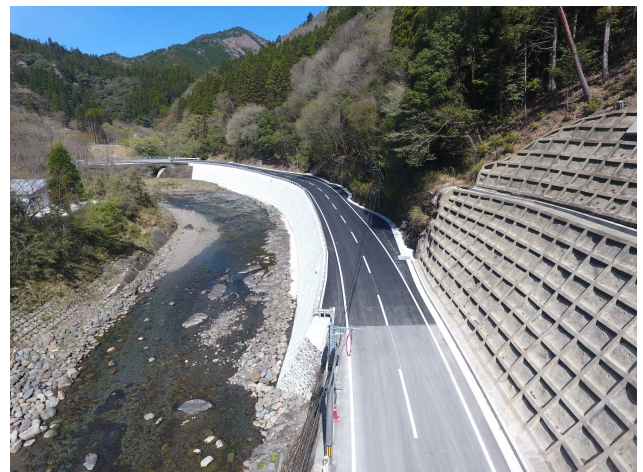
西都南郷線 上渡川工区