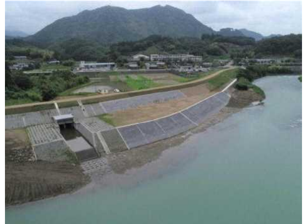
鶴野内地区（護岸工）R3年完成