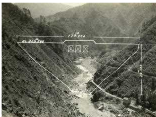
ダム建設前の渡川 (S27.3)