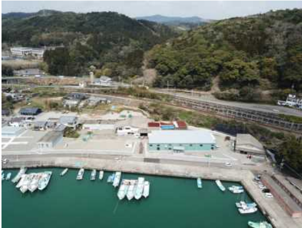
幸協地区（護岸工、嵩上げ工）

現在、幸協地区において土地利用一体型水防災事業、福瀬地区において福瀬大橋の橋梁架替、白浜地区において築堤の計画・調査・設計に取り組んでいます。