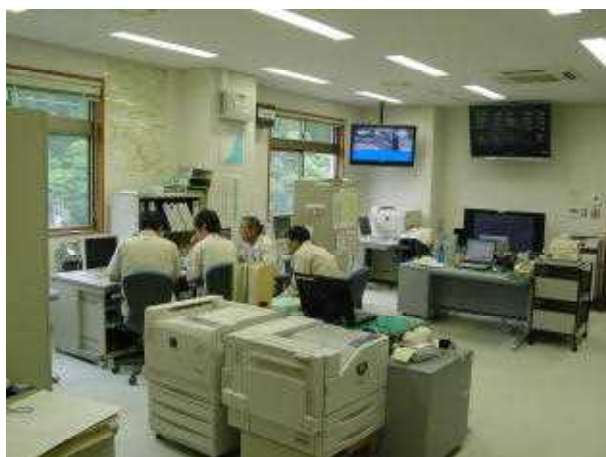
ダム管理の様子(管理事務所内)