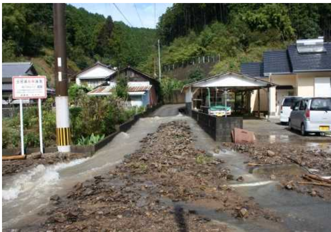
日向市西川内谷川4 被災状況(H24. 10. 7)

令和4年度に西川内谷川4が完成し、現在、鵜毛谷川2ほか4溪流において、事業を実施し、土砂災害対策に取り組んでいます。