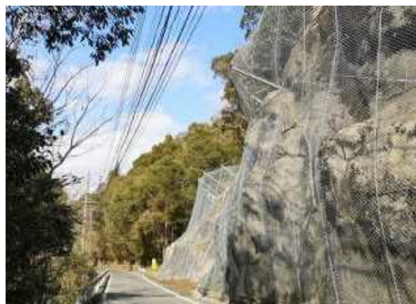
国道388号 美郷町南郷区 前平工区