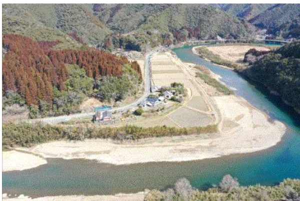
上井野地区～笠原地区（河道掘削）

現在、流下能力が低い区間（上井野～笠原、小松地区、大池地区）において河道掘削等を集中的に実施し、早期の治水安全度の向上に取り組んでいます。