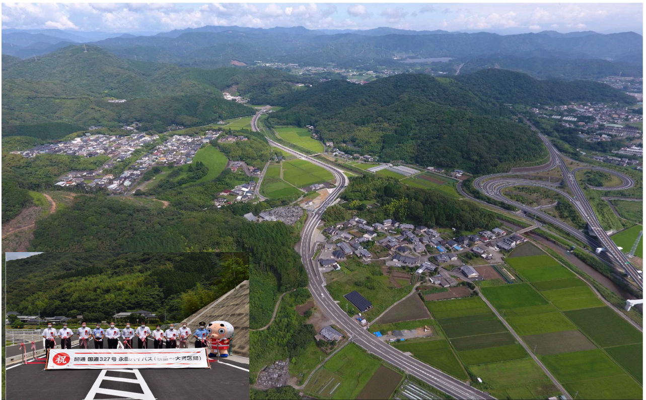
国道327号 永田バイパス（日向市秋留～大斉区間）（令和4年7月開通）