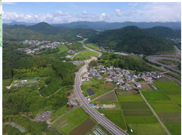
国道327号 永田バイパス (日向市秋留～大斉区間) (令和4年7月開通)