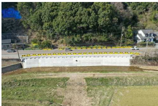
国道327号 日向市東郷町 永田工区

緊急輸送道路等の防災強化や、安全かつ円滑な交通の確保を図るため、道路防災点検結果や特定土工点検に基づき、落石の危険がある箇所や擁壁の損傷箇所において防災対策事業を実施している。また、老朽化が進行してる橋梁・トンネルの維持補修事業を実施し、災害に強い道路ネットワークの整備充実を図っている。