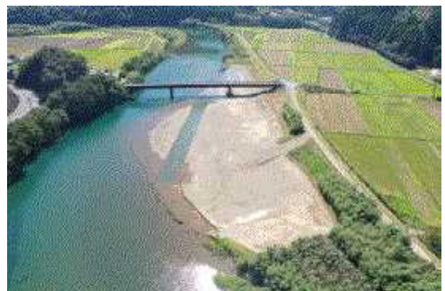
大池地区（河道掘削）