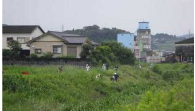
【草刈・清掃作業の様子】

令和4年度は、協定を締結した延岡地区建設業協会に、松山川で草刈・清掃等のアダプト活動を実施していただきました。