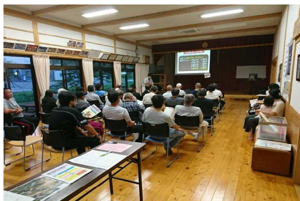
【土砂災害防止法についての説明会の様子】

「土砂災害防止法」に基づき、土砂災害の危険がある箇所の基礎調査を実施して土砂災害警戒区域等の指定を行い、市町村が行う警戒避難体制の整備等を支援します。