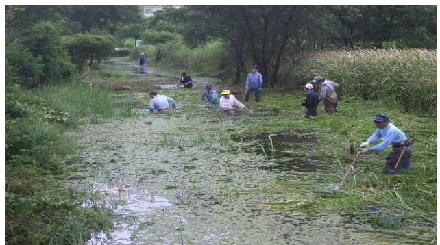
【河川清掃活動の様子】

総流防「家田・川坂川」自然再生事業の実施にあたり、地元と一体となった事業の推進を図るため、地元が主催する河川清掃活動に参加するとともに、自然再生の重要性について広く啓発に努めています。