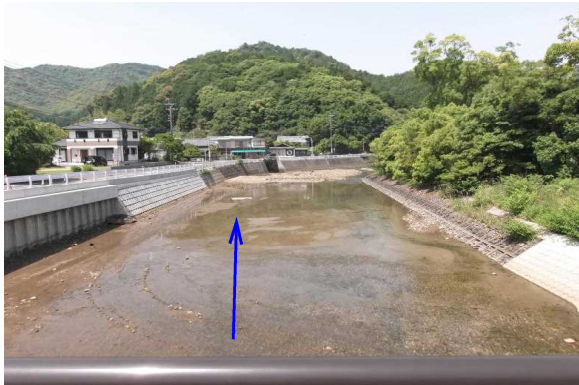
【護岸完成（飛川橋下流）】