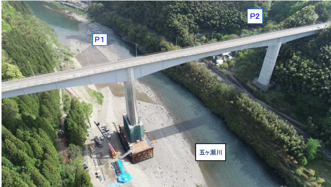
【国道218号 天馬大橋 全景（下流側から撮影）】