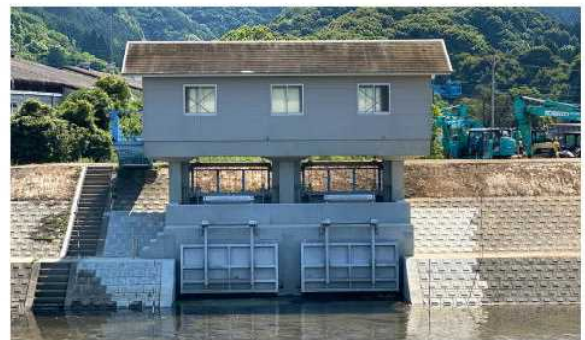
【沖田川水系石田第1樋門】

令和4年度までに、沖田川水系で樋門ゲートの自動閉鎖化が完了したところであり、引き続き、浜川防潮水門の耐震化などを進めていきます。