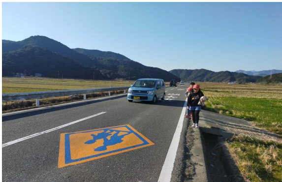
【沖田工区道路状況】