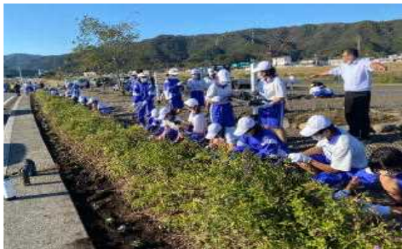
【延岡インター線 岡富中学校・NPO団体】