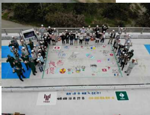
県道北方北郷線 川水流橋 (令和4年12月完成)