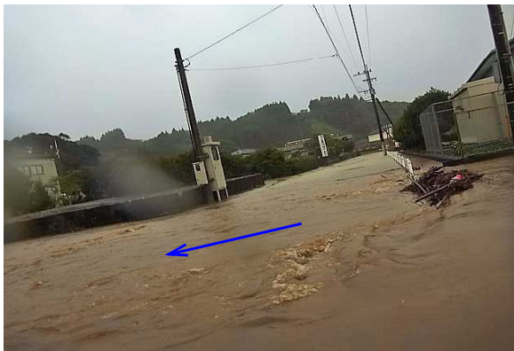
【平成26年の浸水状況】

浦上川沿川の家屋浸水被害を防止するため、平成30年度より橋梁、護岸等の河川改修事業に着手しています。