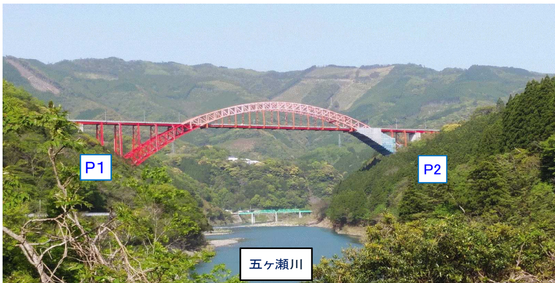
【国道218号 干支大橋 全景（上流側から撮影）】

P1・P2橋脚補強（コンクリート巻立）、粘性ダンパー設置、アーチ支承部改修、座屈拘束プレート取替 [H26～R4]