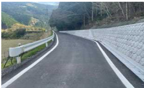
【板上曾木線整備状況（三椏工区）】