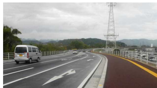
【安賀多通線交通状況】