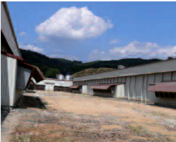
図1 鶏舎周囲の除草

また、鶏舎内のネズミの餌場、住みか、通り道を撤去・清掃する（図2）。羽毛やビニールなどは格好の巣材となってしまう。完全に行うことは難しいが、できるだけ実施する。