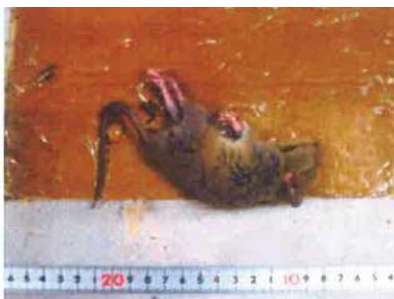
図4 粘着マットにより捕獲したクマネズミ (三重県畜産研究所 中小家畜研究課 西川 薫 原図、鶏病研究会より掲載許可)

粘着式捕獲器(粘着マット)は簡単に設置できるが(図4)、少数の設置 では効果は低いため、できるだけ隙間を少なくし、敷き詰める(図5)。 ただし、ホコリや塵が多い鶏舎では、随時、交換が必要となる。