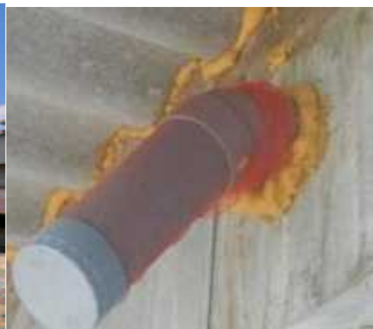
図2 整理整頓された鶏舎内と パテで隙間を埋めた配管