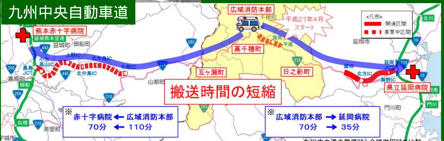
九州中央道未整備時と全線供用時を比較 宮崎県試算