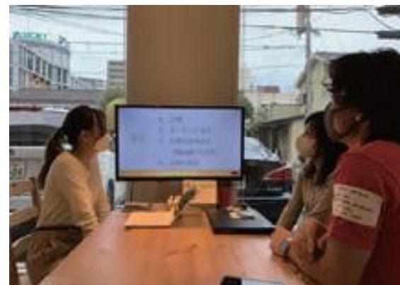
(インターンシップ)

【主な実績】インターンシップ受入企業数:52社、参加者数:149人 ヤングJOBサポートみやざきの運営 延べ相談利用者:2,713人、就職決定者:262人