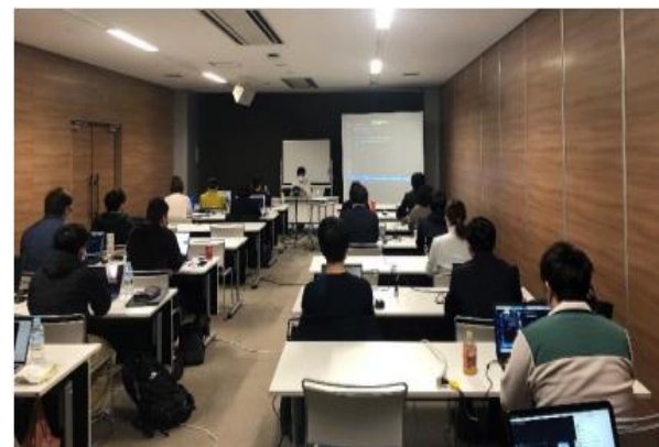
(ICT企業技術者を対象とした連続講座)