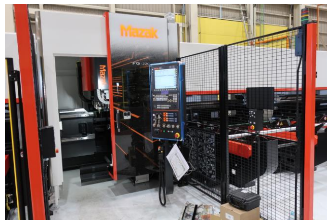
(設備導入資金を活用して導入された高精度金属加工機(左)と三次元ファイバーレーザー加工機(右))