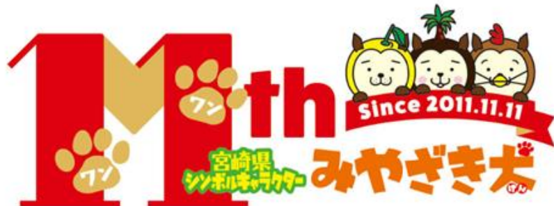
（「みやざき犬」発見11周年記念ロゴマーク）