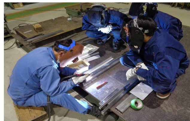
（次世代人財協働実践プログラム （溶接技術分野））

【主な実績】溶接技術：2校、14人参加 ロボット技術：4校、9人参加 ICT技術：2校、8人参加