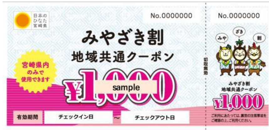
(みやざき割クーポン)

【主な実績】市町村と連携したプレミアム付商品券発行等消費喚起策 県民等を対象に県内旅行の割引支援やクーポンの付与