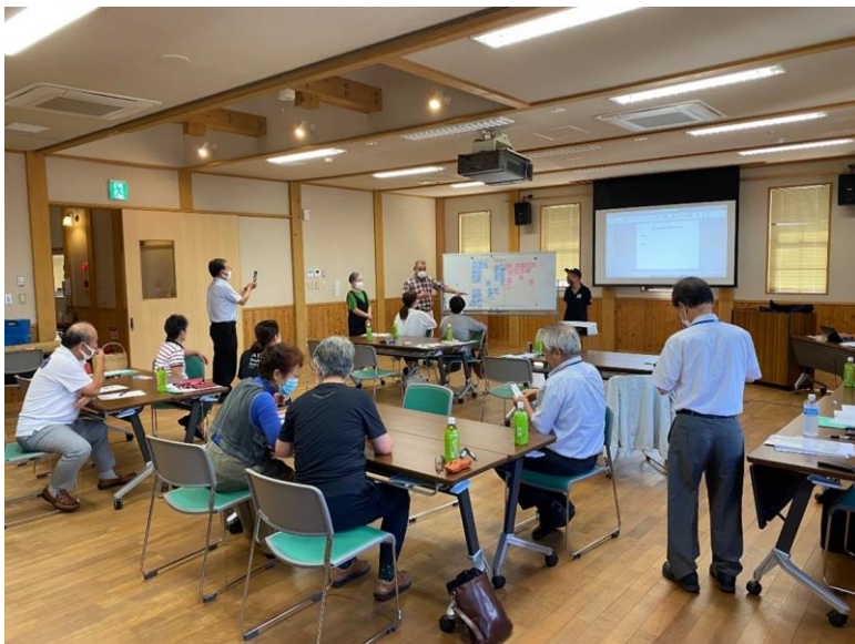
（商店街ステップアップ支援事業）