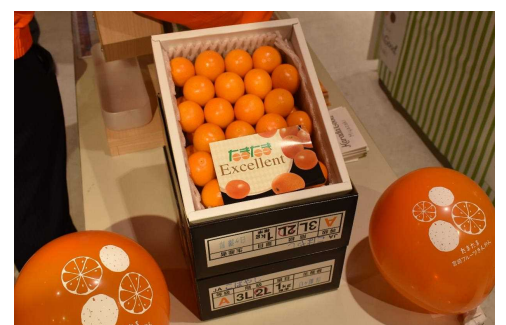
■今年も美味しい「たまたま」がそろいました！