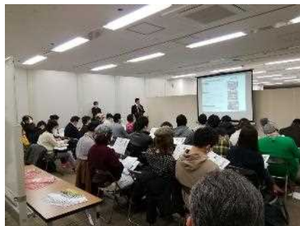
■移住セミナーの様子

交流会では、チキン南蛮や冷や汁などの「宮崎グルメ」が登場し、料理を囲みながら宮崎の話に花が咲いていました！