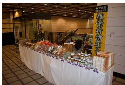
■椎葉村の特産品の販売も行われました！

2月15日（土）、大阪市の国立文楽劇場で「みやざきの神楽 国立文楽劇場公演」を開催しました。