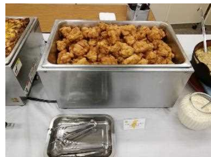
■チキン南蛮や冷や汁などの「宮崎グルメ」が登場！