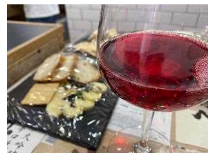
■五ヶ瀬ワインも販売されました！