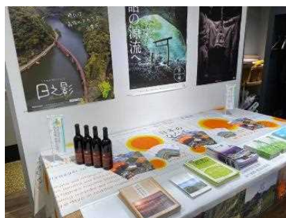
■ポスター展示とパンフレット