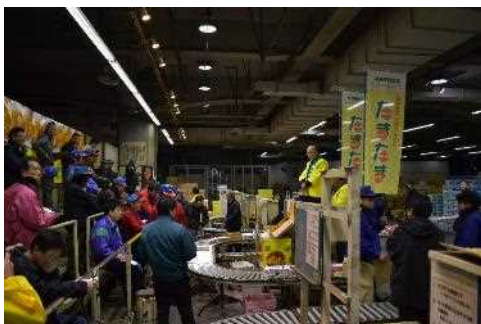
■1月14日早朝の大阪市中央卸売市場