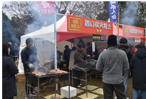
■鶏の炭火焼きの美味しそうな香り！