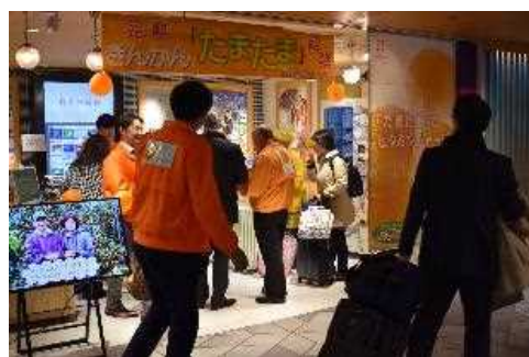
■大阪国際空港の特設ブース

また、大阪国際空港では、「たまた ま」の解禁に合わせ、試食イベントを開 催し、お客様に試食していただきました。 お客様からは、「こんなに甘いんです ね！」、「美味しくてびっくりした！」 という嬉しい声が聞かれました！