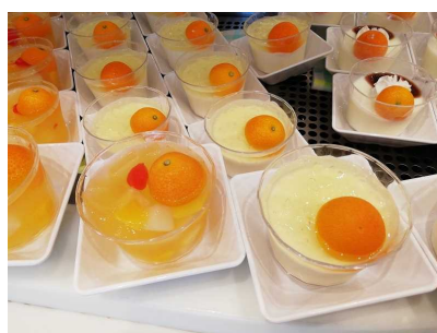
■「たまたま」を使用したデザート

2月20日（木）、大阪市の日本生命保険相互会社大阪本店で「宮崎ひなたフェア」を開催しました。