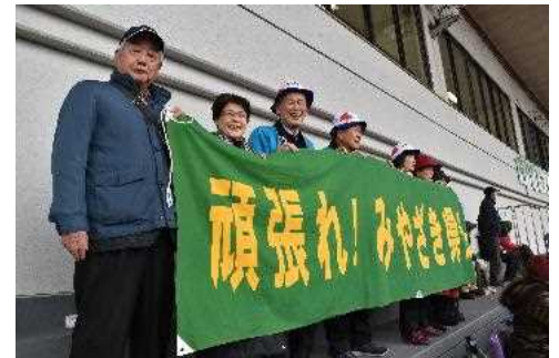
■県人会の皆様も力強く応援されていました！