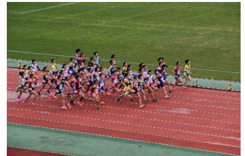
■スタート直後の様子

また、メイン会場の西京極 総合運動公園では、19道 県の県人会が郷土料理や物産 を販売する「ふるさと屋台村」 が登場し、京都宮崎県人会の 皆様が鶏の炭火焼きや焼酎を 販売され、多くのお客様が宮 崎県の食を堪能していました。