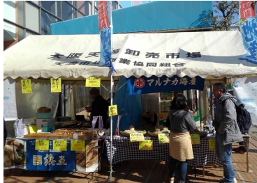
■特設販売スペース