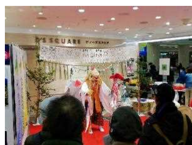
■高千穂の夜神楽特別公演