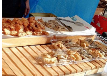
■メヒカリ・フグの唐揚げ