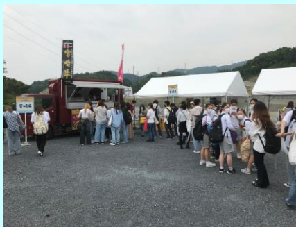
◀ニッポンうまいものマルシェin彩都 (大阪府茨木市)

イベントの詳細はUR都市再生機構HPのレポートをチェック▼ https://www.ur-net.go.jp/west/tsunagu/report/20220521saito.html