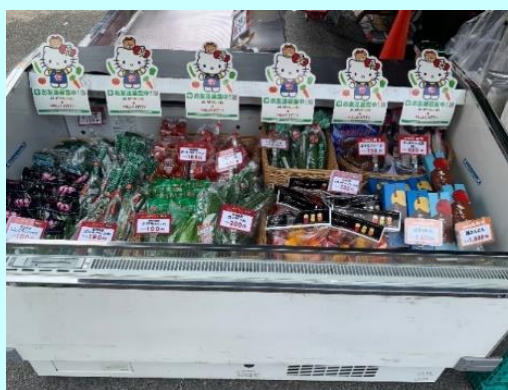
▲ひいくんもマンゴーを販売してくれました!!