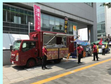
Fasaka Market▶ (大阪市北区梅田)

今後もキッチンカーの出動するイベントが計画されておりますので、イベント実施の際はぜひ足をお運びください。（中村）