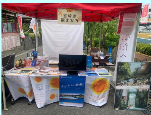
◀宮崎県の観光を存分にPRできました!!