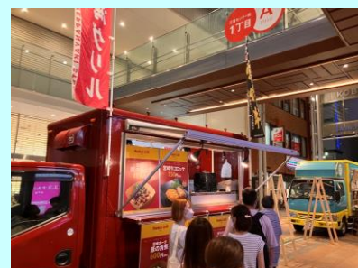
三宮センター街 ヨルバル▶ (神戸市中央区)