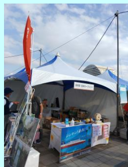
◀新船「たかちほ」のPR頑張りました！！

5月14(土)～15日(日)に神戸市のメリケンパークで、神戸まつりの代替イベント「KOBE元気まつり2022」が開催され、神戸市と連携協定を結んでいるご縁で、宮崎県もブース出展しました。