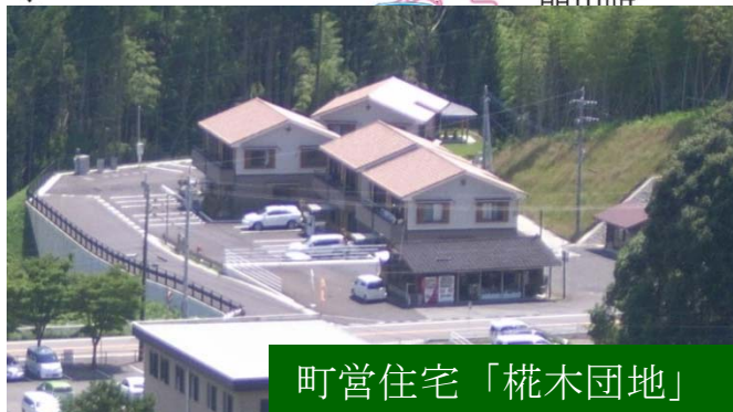
提供：日之影町（H28年6月撮影）

高速道路の整備により、隣の市町へのアクセスが向上され、通勤・通学等の負担が軽減される。