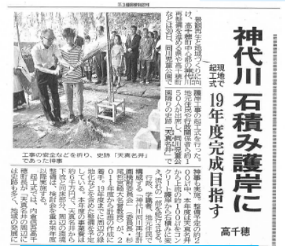
H28. 7. 31付宮崎日日新聞