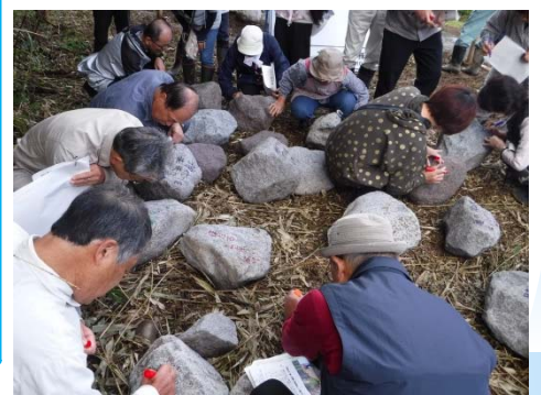
石積に書き込まれる地域の方々の思い。。