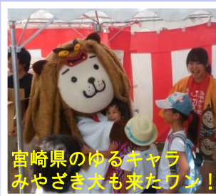
宮崎県のゆるキャラ みやざき犬も来たワン！