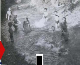
以前の天真名井(昭和30年代)