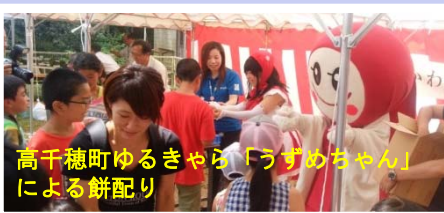
高千穂町ゆるきゃら「うずめちゃん」 による餅配り