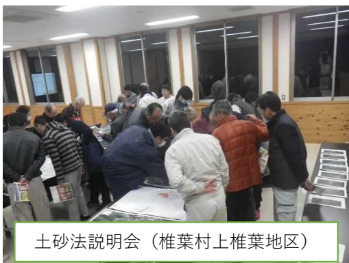
土砂法説明会（椎葉村上椎葉地区）