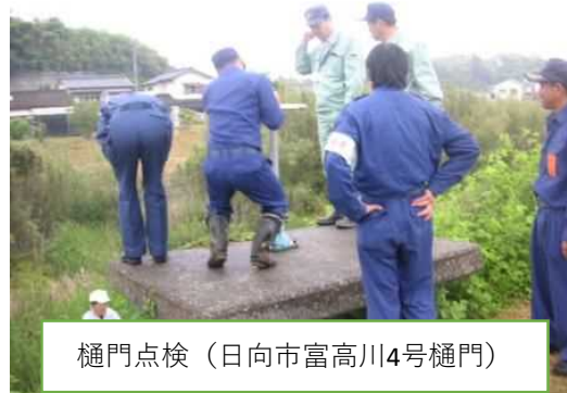
樋門点検（日向市富高川4号樋門）