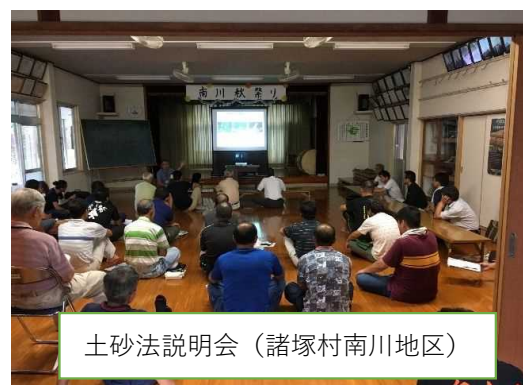
土砂法説明会（諸塚村南川地区）