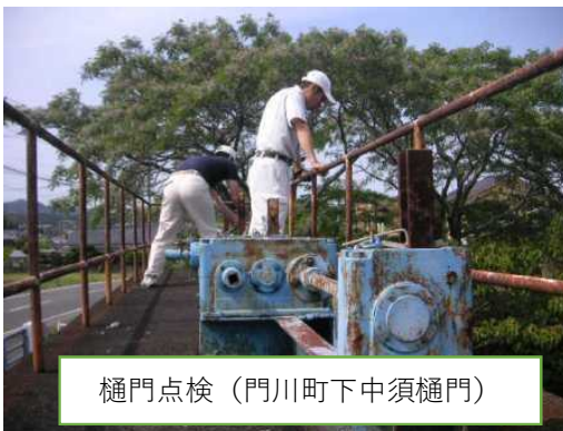
樋門点検（門川町下中須樋門）