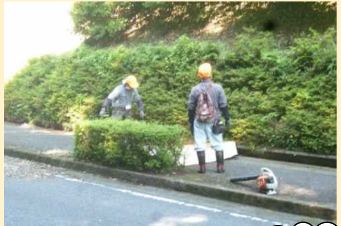
盛り上げ隊による草刈り活動〔小林市野尻町紙屋地区〕