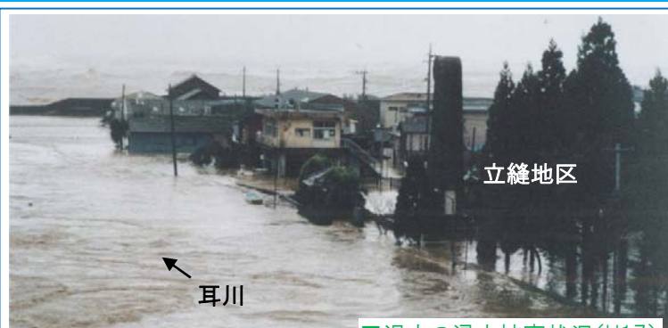
過去の水害被害状況(H17) 立縫地区での住家被害：家屋半壊3棟、床上浸水3棟、床下浸水2棟