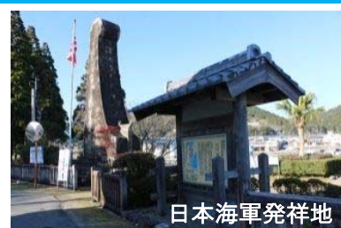
伝建地区観光客数