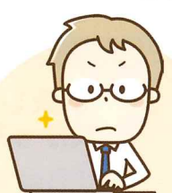
【社会保険労務士】 17名