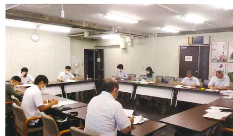
【経営戦略会議】 相談内容に応じて専門家を選定します。