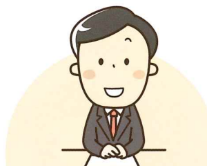
【中小企業診断士】 9名