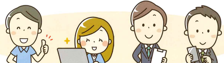
【その他の専門家】 8名 弁護士、マーケティング、販売戦略、 六次化、GAP、JAS 認証、集落営農法人