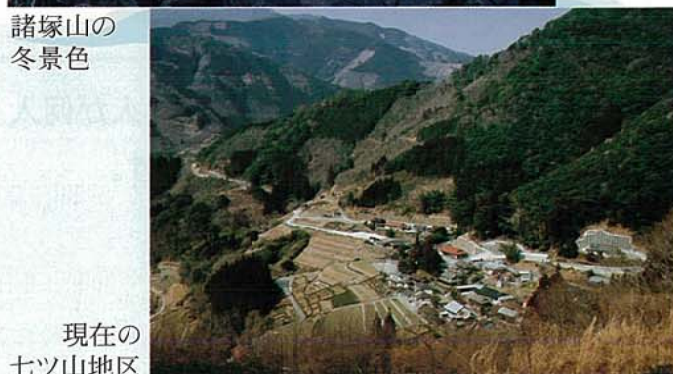
現在のセツ山地区