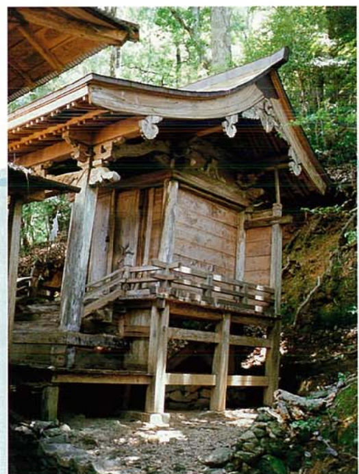
市山神社(神社の所在地は椎葉村です。)

この伝説は、当時の木材が、耳川を利用した川流しによって美々津に運ばれたこと伝えるものです。