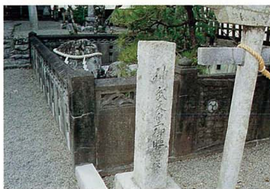
神武天皇が腰掛けたといわれる岩

【2-8】：一説には、立岩大明神こそ神武天皇で、梶の節の舟に乗って耳川を下ったと言われており、それから立岩では梶の節はたいまつに焚かないと言う風習が残されています。