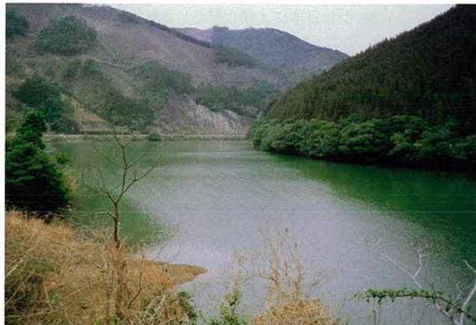
中州のお宮があつた場所 ※現在、中州のお宮があつた場所は、大内原ダム だいなるだむ の建設によって湖底に沈んでしまいました。

[2-10]:西郷村大字田代おそきに、おそき太郎をまつる ほこら 祠 ほこら がありますが、旧暦 きゅうれき 11月6日に「おそきさんの祭り」が行われています。以前は川の中州にお宮があり、大きい石がまつつてありました。そのそばに池があつたところから、おそき太郎を池の水神とも称したとされています。この祭日には必ず村の若者が盛んに相撲をとっていました。