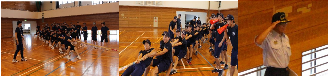
消防学校初任科生、警察学校初任科生集合写真