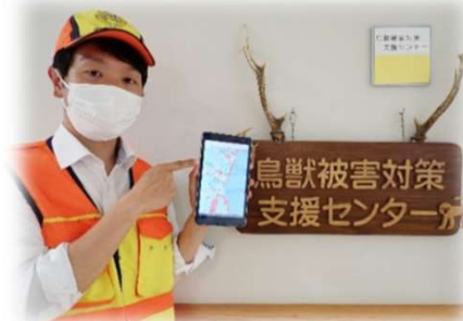
スマートフォンで簡単表示

今回作成した地図を通して、若い狩猟者・有害鳥獣従事者が増えることを期待しています。今期の猟は終了しましたが、興味がある方は是非お声がけください。