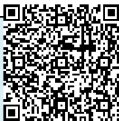
『電子版鳥獣保護区等位置図』QRコード