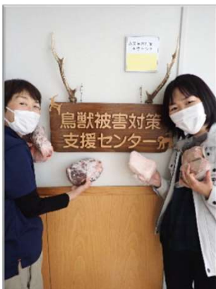
獲った獣はお肉にします