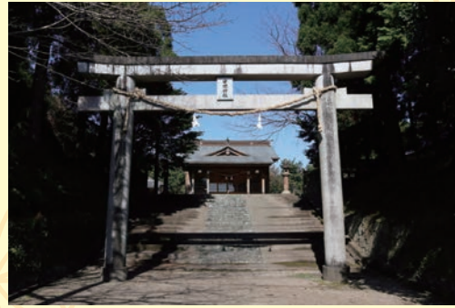
◆ [串間市] 串間神社

トヨタマヒメと山幸彦との子ウガヤフキアエズノミコトの生誕の地に鎮座するとされています。トヨタマヒメがわが子を思っ て残したといわれる「お乳岩」やトヨタマヒメが綿津見宮から 乗ってきた亀がそのまま岩になったとされる「亀岩」があります。