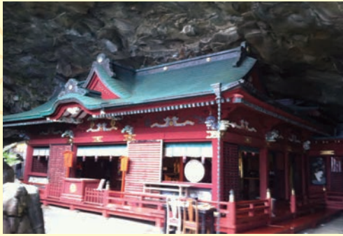
◆ [日南市] 鶴戸神宮

海幸彦や山幸彦など神々ゆかりの地が残る日南市と串間市。自然に囲まれながら、息づく神話に思いを馳せる旅に出かけましょう。