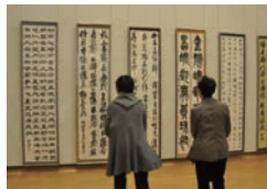
第45回宮崎県美術展の様子