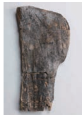
木製短甲 (雀居遺跡/福岡市埋蔵文化財センター所蔵)