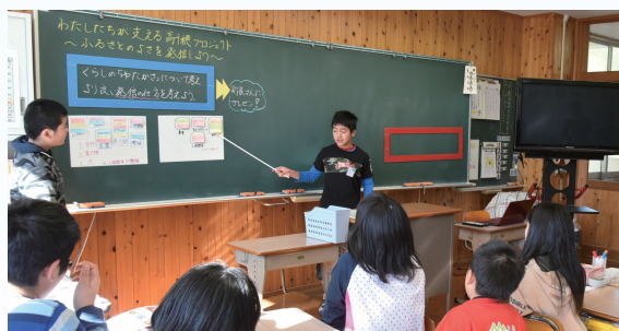
高千穂町立上野小学校の授業での活用風景