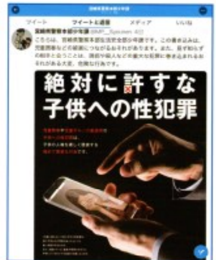
▲児童買春等につながる投稿への警告画面