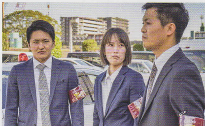
けいじ き こ そうさ は こ そうさ 刑事の聞き込み捜査、張り込み捜査など