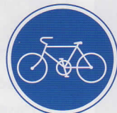
じてんしゃせんよう 自転車専用