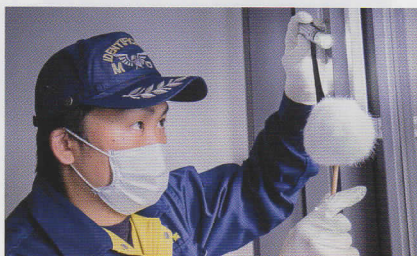
かんしきかつどう 鑑識活動