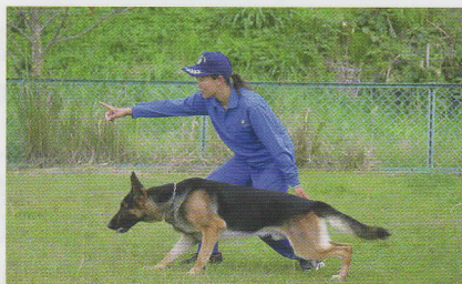
けいさつけん 警察犬