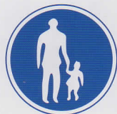
ほこうしゃせんよう 歩行者専用