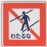
ほこうしゃおうだんきんし 歩行者横断禁止