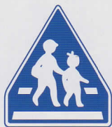
おうだんほどろ 横断歩道