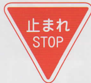
いちじていし 一時停止