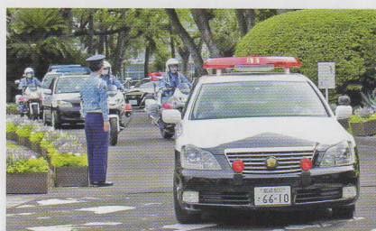
パトカーと白バイの活動