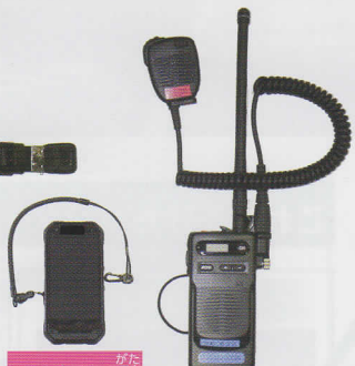
がた スマートフォン型 端末 データ