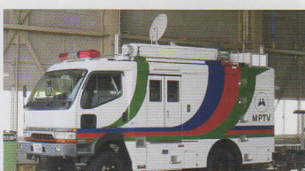
えいさうそうしんしゃ 映像送信車