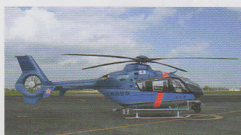
ヘリコプター(ひむか)