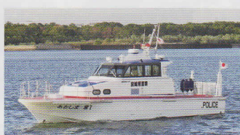
せんぱく 船舶(あおしま)