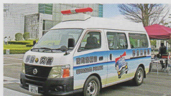
いどうこうばんしゃ 移動交番車