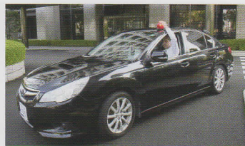
そうさようしゃ 捜査用車