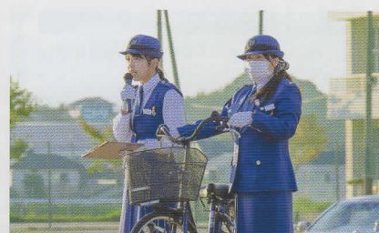
こうつう あんぜん きょうしつ 交通安全教室