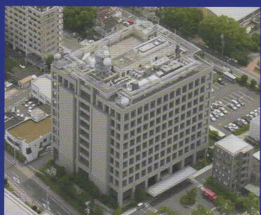
けいさつほんぶ 警察本部