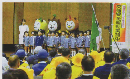
こうつうあんぜんうんどう 交通安全運動

こうつうじこ あんぜん しゃかい たいさく すず 交通事故のない安全な社会をめざし、さまざまな対策を進めています。