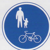
じてんしゃ ほこうしゃせんよう 自転車および歩行者専用