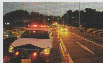
こうつうとりしま 交通取締り