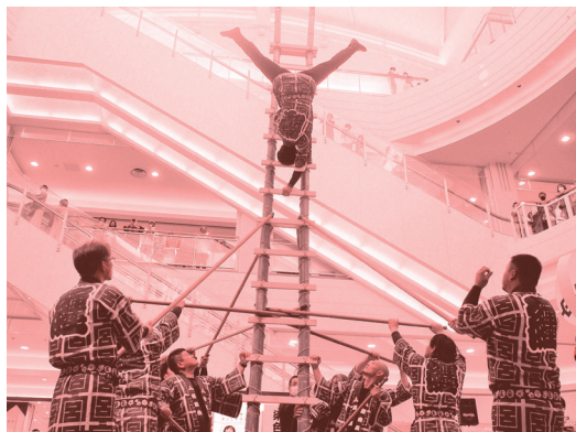
宮崎県とび技能士会による実演の様子(R2年度)

県民の皆さまへ、ものづくりの大切さ・おもしろさ・重要性を伝えるイベントです。 熟練技能士の実演や、ものづくり体験（技能体験）などを通して、ものづくりに対する興味・関心を持って頂けるような内容になっています。