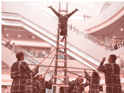
宮崎県とび技能士会による実演の様子(R2年度)

県民の皆さまへ、ものづくりの大切さ・おもしろさ・重要さを伝えるイベントです。熟練技能士の実演や、ものづくり体験（技能体験）などを通して、ものづくりに対する興味・関心を持って頂けるような内容になっています。