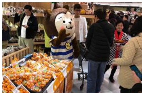
SOGO「宮崎きんかんフェア」

宮崎で大人気のイベント「きんかんヌーボー」を海外で初めて開催しました！告知をしてすぐに定員オーバーとなる盛況ぶり、香港メディアからも、これまでにない面白いイベントだと多くの問い合わせをいただきました。