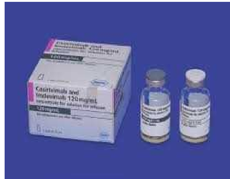
中和抗体薬ロナプリーブ