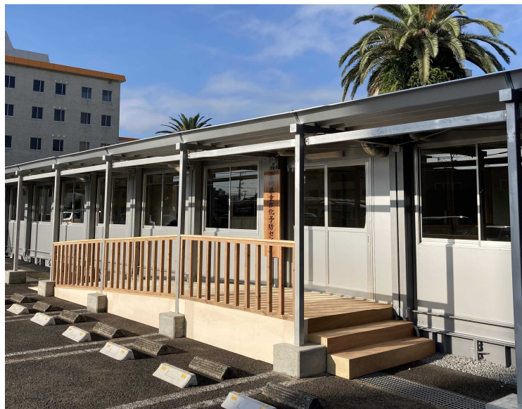
宮崎県重症化予防センター