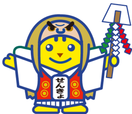
神楽めいすいくん