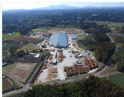
【最新鋭設備の志布志工場】

ホームページURL https://toyama-woodsupport.com