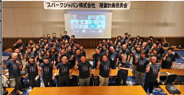
【経営計画発表会の様子】