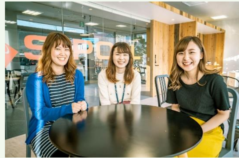
【弊社オフィスと現場で働く社員】