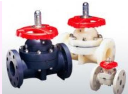
【【主力製品である樹脂バルブ】】