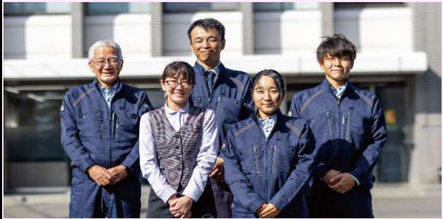
【増田工務店で働く仲間】