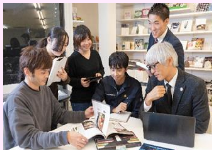
【営業、制作、編集の3部参加の打合せ風景】

広告宣伝計画の総合プランニング、ブランディング 広報代行サービス、Web制作、通販Webサイト制作、LP作成、ふるさと納税PR代行業務 地域の食と全国のバイヤーを繋ぐタメシヨク運営