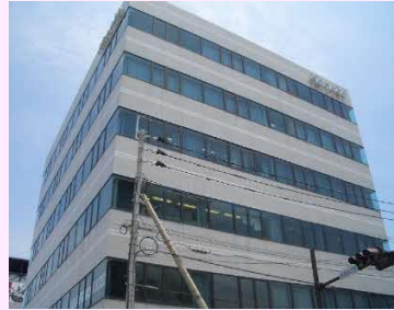
【宮崎開発センター】

【事業概要】 ソフトウェアの設計・開発 業務システム構築サービス コンサルティングサービス