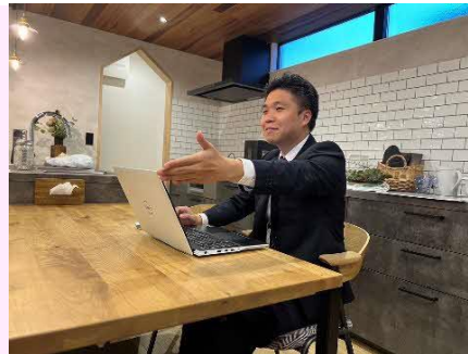
【打ち合わせの様子】