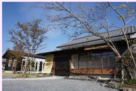
【古民家を改装した高鍋事業所】

エイムネクストは、製造業やサービス業のお客様を中心に、コンサルティングサービスを提供している会社です。ビジネスや業務の視点と、技術(IT、製品開発におけるソフトウェア)の視点の両方を大切にしています。