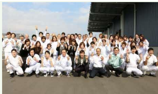
【弊社社員集合写真】