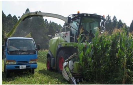
【コーンハーベスターによる収穫作業】