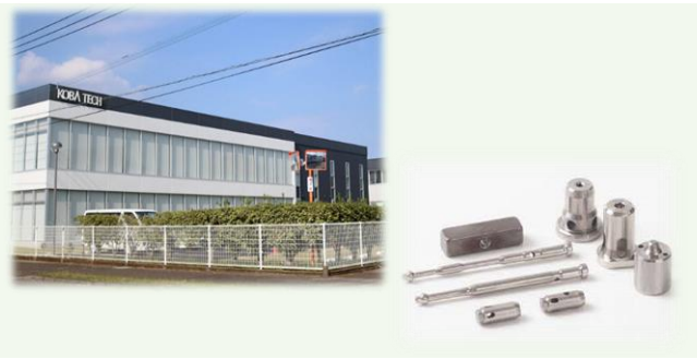
【第2工場外観 主要製品の自動車部品】