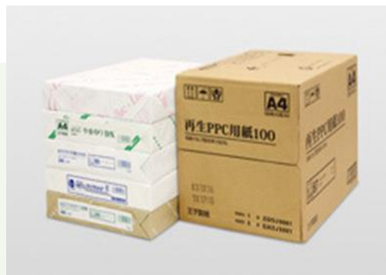
【日南工場の主力製品 PPC用紙】