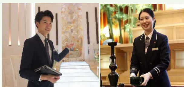
【婚礼及び葬祭スタッフ】