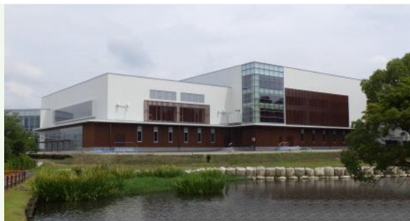
【早水公園サブアリーナ武道場建設工事】

都城市を中心に建設業(建築・土木・舗装・管工事等) 一級建築士事務所・運送業を展開 都城市クリーンセンターやサブアリーナの建築工事 都城志布志道路や山之口陸上競技場造成工事など 実績多数