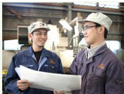
【作業打合せの様子】