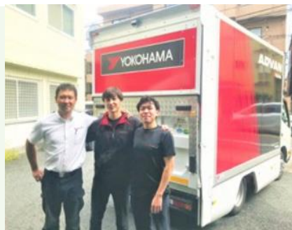
【ヨコハマタイヤ営業社員】