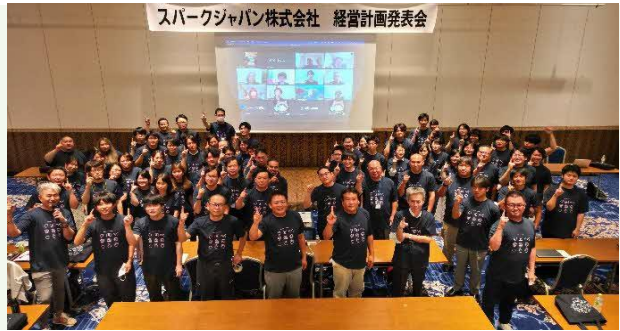
【経営計画発表会の様子】