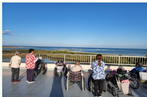
【当施設の屋上からの景色です。】

人と人とのコミュニケーションを大事にしていく介護をチーム一つになって目指しています！