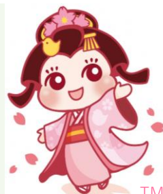
イメージキャラクター