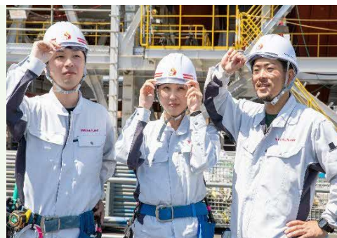
【南九州営業所で働く先輩たちです】