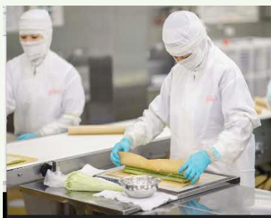
【デザートロールケーキ】