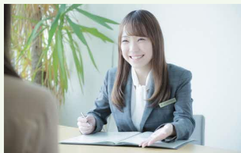
【求職者様との面談の様子】