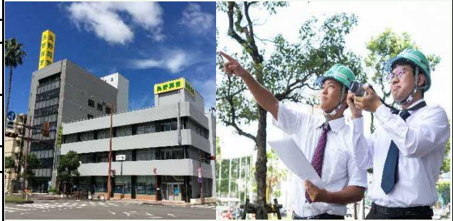
【矢野興業本社ビル・技術職員】