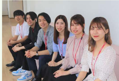
【20代、30代の社員が多数活躍中！】

当社ではマーケティング支援を行うシステム（チャット、テレマ）の開発を行い、その後の運用代行までを行っています。 更に運用代行で得た知見を専門のチームが研究し、システムの開発に活かすことで、システム開発・営業力・営業コンサルの3つの分野に特化しています。