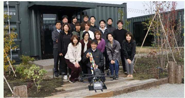
【本社正面にて2022年12月】