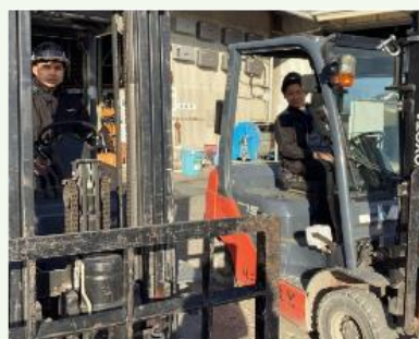
【現場準備中の写真】