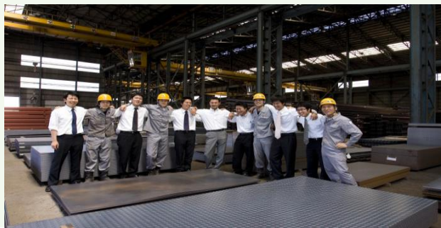
【弊社小倉支店倉庫】

ホームページURL https://www.onoken.co.jp/jp/index.html