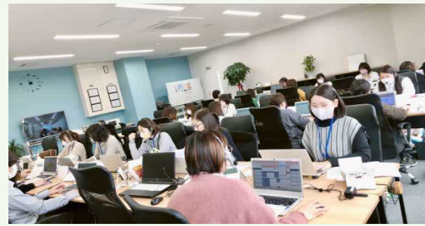
【テレマーケティング業務風景】

【事業概要】 営業関連の総合支援事業、有料職業人材紹介事業 財務支援事業、テレマーケティング ウェブ制作等、各種ソリューション提供業務