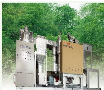
【木質ペレット焚蒸気ボイラ】