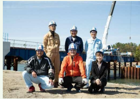
【宮崎港緑道橋現場にて】

【事業概要】 特定建設業 ・土木工事の施工管理業務 (道路、トンネル、橋梁、法面、河川)