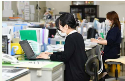
【女性社員も働きやすい環境】

企画・提案から、デザイン・ノベルティグッズ等の考案、出版等を行っています。小ロットオンデマンド印刷から大量ロットのオフセット輪転機を有する製造ラインを備えた総合印刷業です。