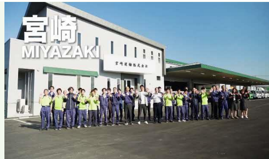
【新社屋の前でパチリ！】