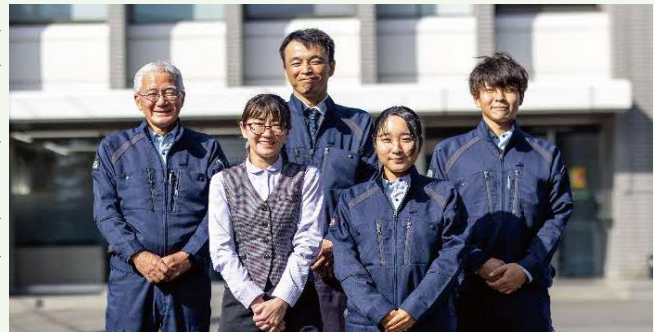
【増田工務店で働く仲間】