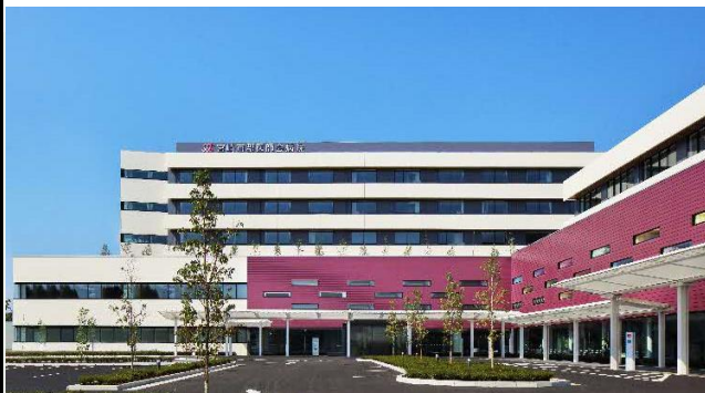
【宮崎市郡医師会病院 正面外観】

1984年4月に会員の紹介入院を主体にした共同利用施設・開放型病院として開院し、会員（開業医）との密接な連携を図りながら、地域の基幹病院として急性期疾患を中心とした医療を担っています。