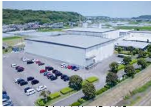
【宮崎本社工場外観】

1984年に創業し、宮崎本社では、半導体のテストハウス、半導体モジュール組立や、特殊素子の組立、基板実装を、東京支社では、RFIDのデバイス設計・開発、関連製品のアプリケーション開発を行っています。