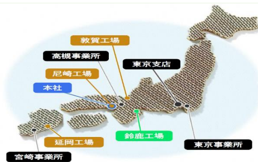
【山下印刷紙器株式会社】