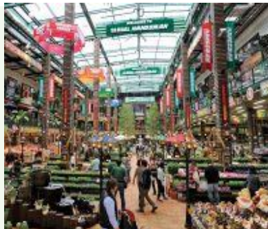
【ハンズマン植物コーナー】

私たちは「住まいと暮らしの改善に役立つこと」を使命とし、お客様の声をもとにした「23万品目の圧倒的な品揃え」と「感動の接客」により、ハンズマンはたくさんのお客様から支持を頂いています。