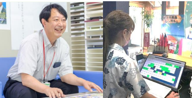
【本社接客業務/フロント業務】

【事業概要】 【住宅建設・販売】土地仕入～住宅建築～販売 【不動産仲介・斡旋業】賃貸物件の紹介・管理 【宿泊施設運営】青島フィッシャーマンズ・ビーチサイドホテル&スパ