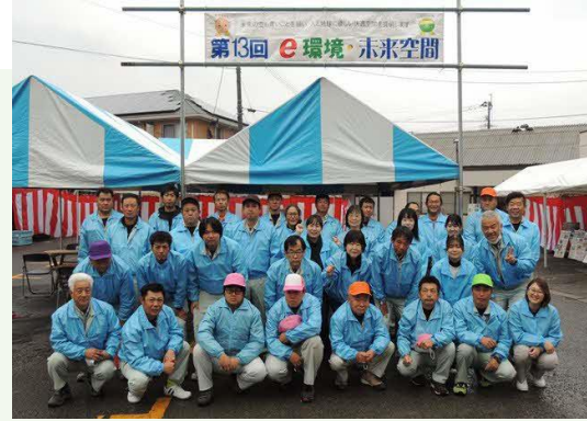
【第13回 e環境・未来空間イベント】

①建設土木工事や解体工事を行っており、産業廃棄物の処理業も実施しています。また、運送業や再生資材の販売業も行っています。