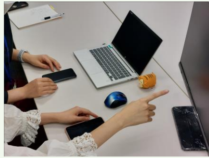
【スマホアプリの評価検証業務の様子】