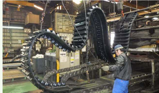
【クローラ製造工程】