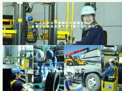
【働きがいのある昇栄】

【事業概要】 荷役梱包作業の請負 第一利用運送業 一般貨物自動車運送事業 倉庫業