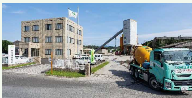
【本社(宮崎県都城市)】

南九州を拠点とする総合建設業。 砂利・生コンクリート製造販売事業、道路改良などの土木事業、造園・建築業、一般家庭のお庭作りまで行うエクステリア事業不動産管理業などを行っています。