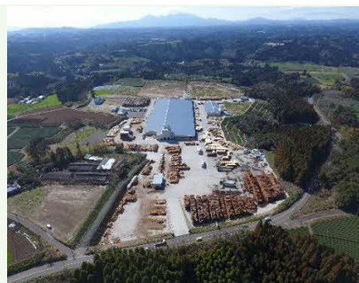
【最新鋭設備の志布志工場】