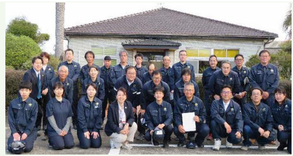
【創宮(株)の仲間たち】