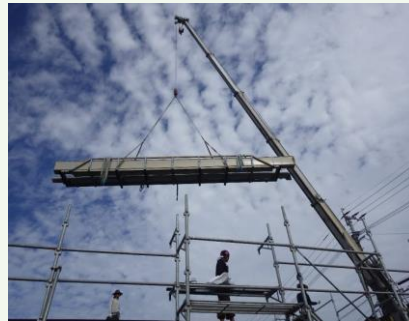
【建設現場で働く社員!!】

【事業概要】 特定建設業（土木・解体・建築・舗装工事業） 産業廃棄物収集運搬処分業