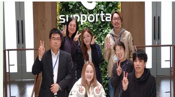
【一緒に働くメンバー】