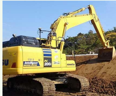
【ICT建機を使用した工事】