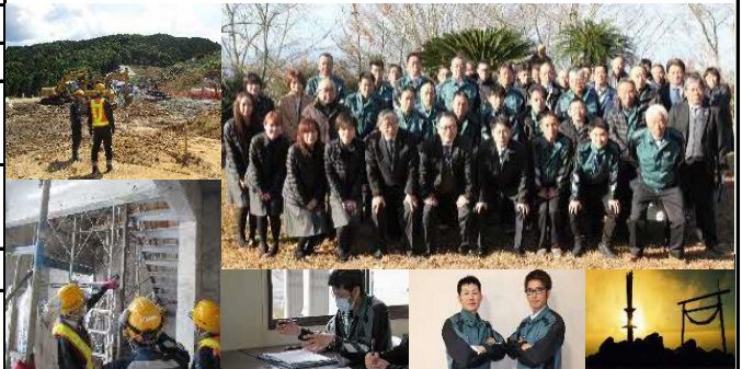
【集合写真・仕事風景】