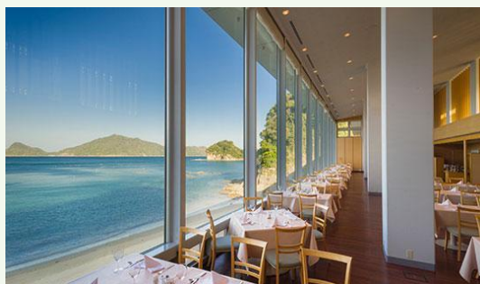
【レストランからの眺望】

ホテル・レジャー事業 ホテル全般に関するサービス業務 (フロントやレストランでの接客、 レストランでの調理など)