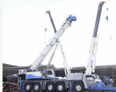
【ラフター・オールテレーンクレーン】