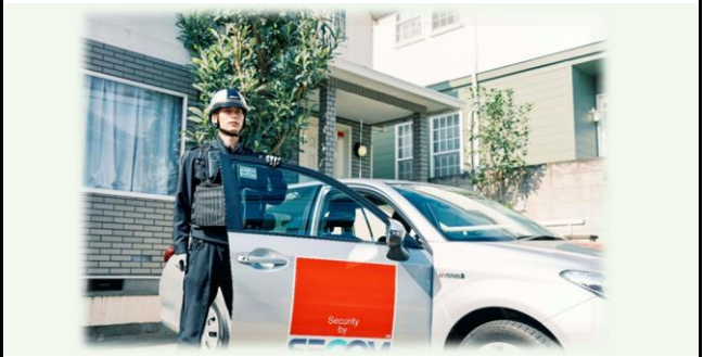
【機械警備サービススタッフ】

【事業概要】 「安全・安心・快適・便利」な社会を創造する革新的なサービスで、不安となる様々な問題解決に取り組んでいます。