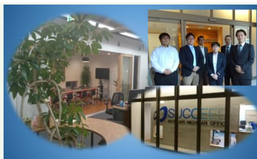
【日南事務所の風景】