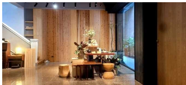
(台湾での常設展示場設置)