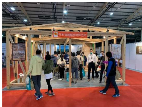
(台湾国際建築室内設計建材展 出展)