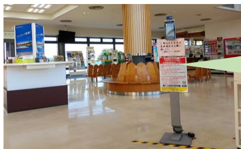
宮崎港フェリーターミナル