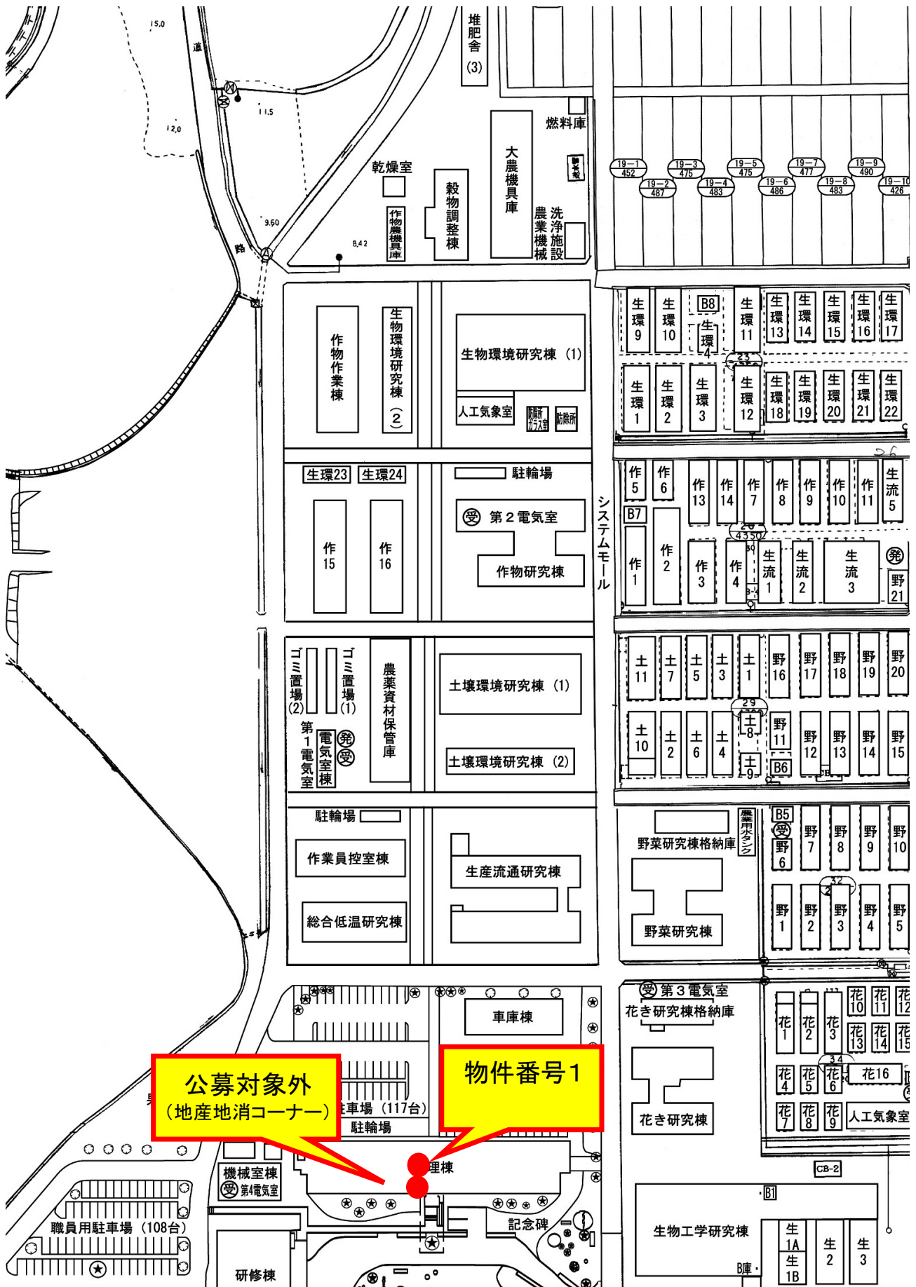
図1 総合農業試験場 自動販売機設置箇所図(全体)