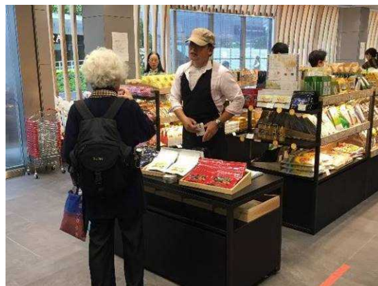
テストマーケティング