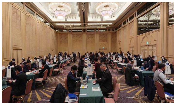
宮崎県産品魅力発見商談会 (シーガイアコンベンションセンター)