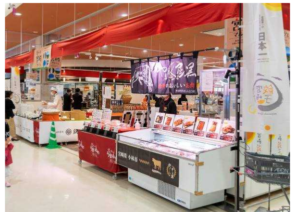
百貨店等での物産フェア