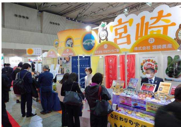
スーパーマーケット・トレードショー2023 (幕張メッセ)