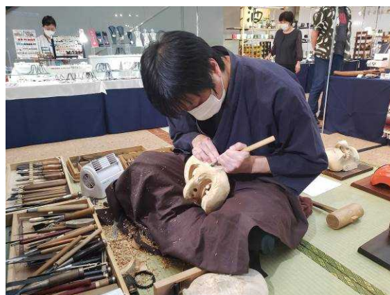
みやざきの工芸品展(宮崎ブーゲンビリア空港)