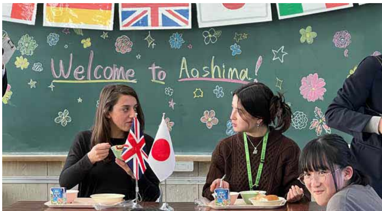
英国の郷土料理を提供(宮崎市立青島小学校)