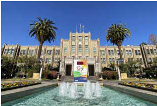
投稿写真より(県庁前)