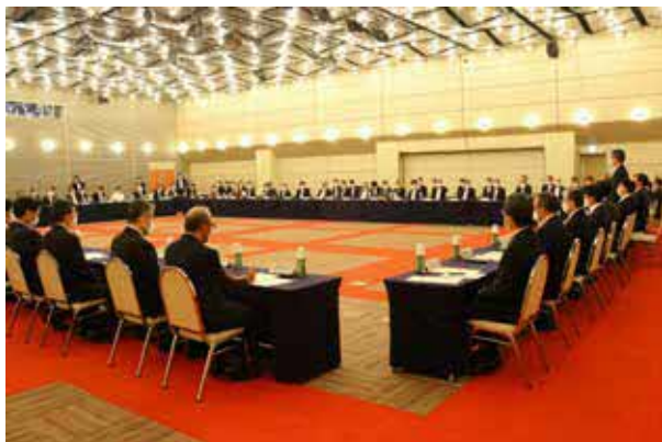
協議会の役員を務める団体代表者や顧問を務める本県選出国會議員らが出席