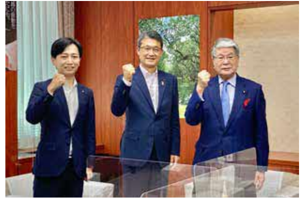
会合の成功に向けた協力を確認