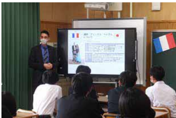
フランスについての講座 (綾町立綾中学校)