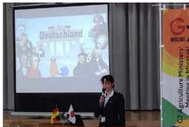
ドイツについての講座 (宮崎市立小松台小学校)