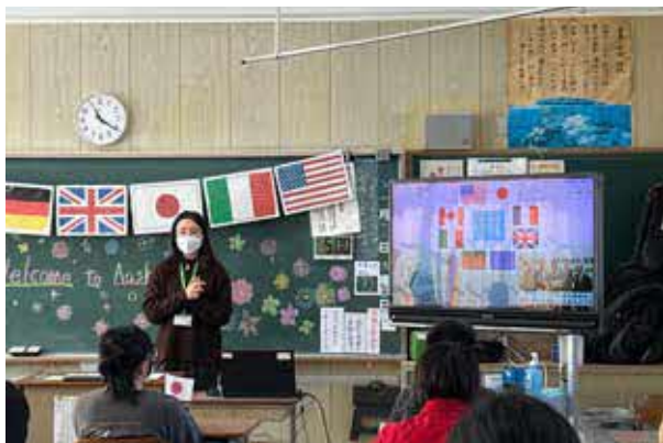
英国についての講座 (宮崎市立青島小学校)