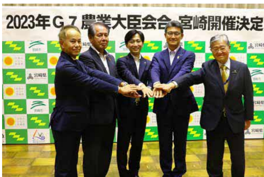
会合開催に向けて団結する各団体の代表ら(左から、片桐フェニックスリゾート株式会社代表取締役社長執行役員、福良県農業協同組合中央会代表理事会長、清山市長、河野知事、米良県商工会議所連合会会頭兼県観光協会会長)