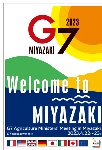
広報デザインポスター(英語版)