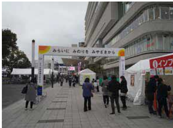
会場入口にウェルカムゲートを設置