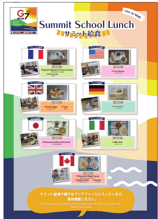
サミット給食の取り組みは、会合会場でもパネルで紹介した。