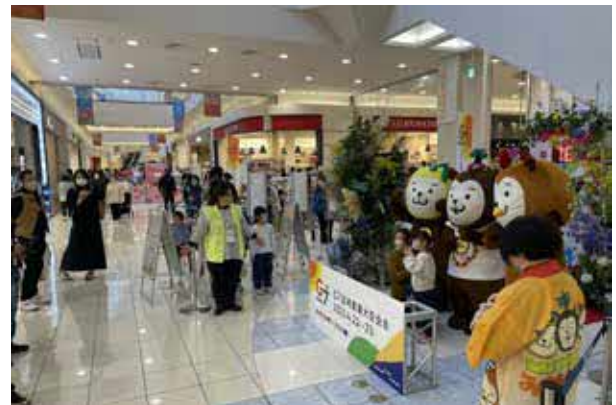
みやざき犬との記念撮影会