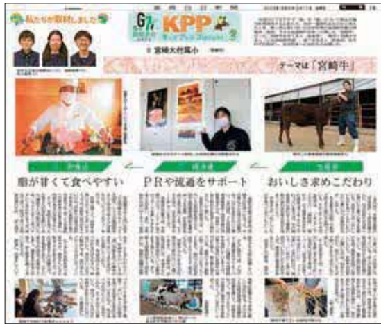
令和5年3月17日(金) 宮崎大学附属小学校