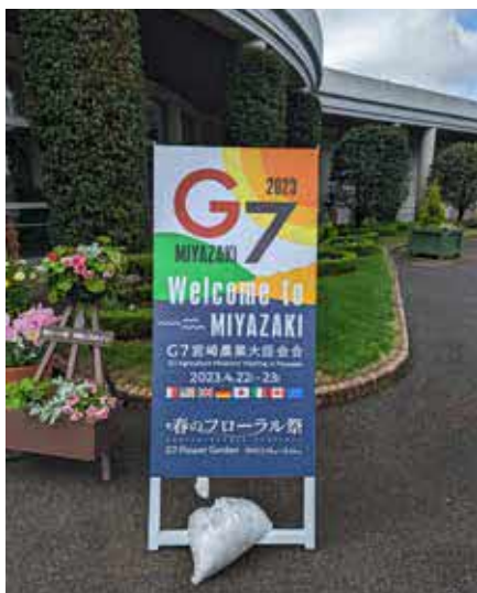
歓迎看板(フローランテ宮崎)