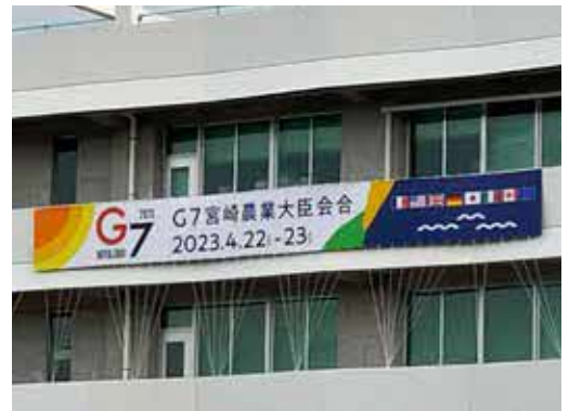
横断幕(宮崎市役所)