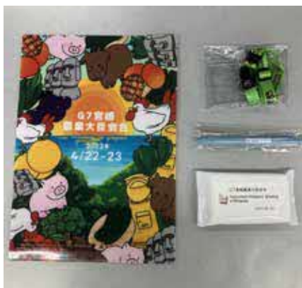
左からクリアファイル、ネックストラップ、ボールペン、ウェットティッシュ