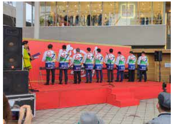
広報デザインの法被 はっぴ を着用した登壇者ら