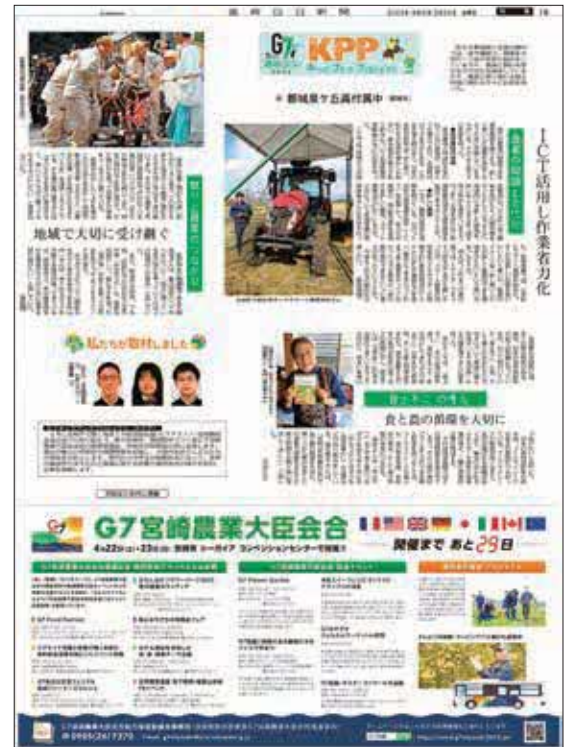
令和5年3月24日(金) 都城泉ヶ丘高附属中学校