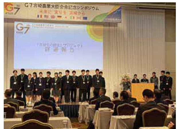
「高校生の提言」プロジェクトの活動報告の様子