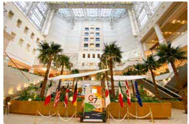
投稿写真より(シェラトン)