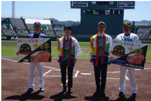
試合前に宮崎牛を贈呈