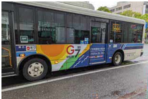
宮崎交通バスラッピング広告