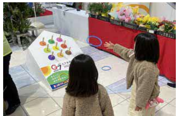
輪投げコーナーの様子