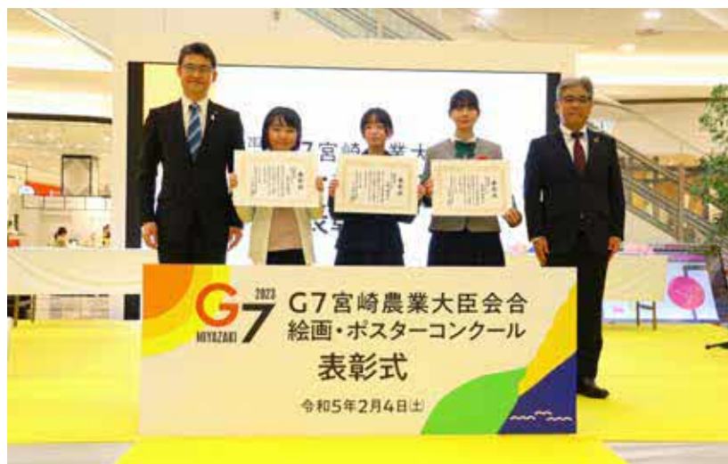
表彰式後の最優秀賞受賞者との記念撮影