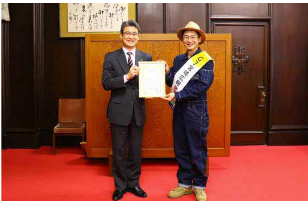
「G7宮崎広報PR大使」委嘱式の様子

農業シンポジウムMC、会合1か月前記念シンポジウムMC、テレビ及びラジオCMのナレーション、テレビ番組等での会合周知、機運醸成イベントへの参加 ほか