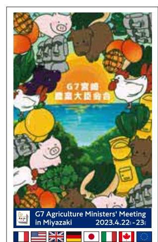
高校生デザインポスター