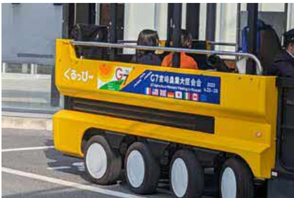
ぐるっぴーラッピング広告