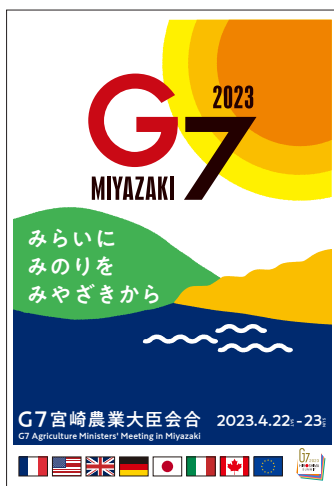
広報デザインポスター(日本語版)

協議会構成団体、県庁、各市町村、各市町村教育委員会、農業関係団体、交通事業者、商業施設、教育施設、コンビニエンスストア 等