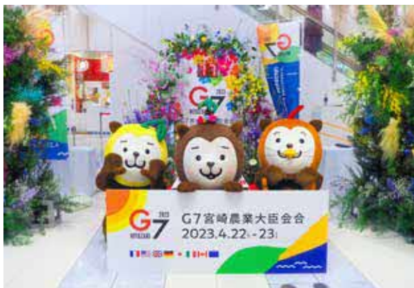
投稿写真より(イオンモール)