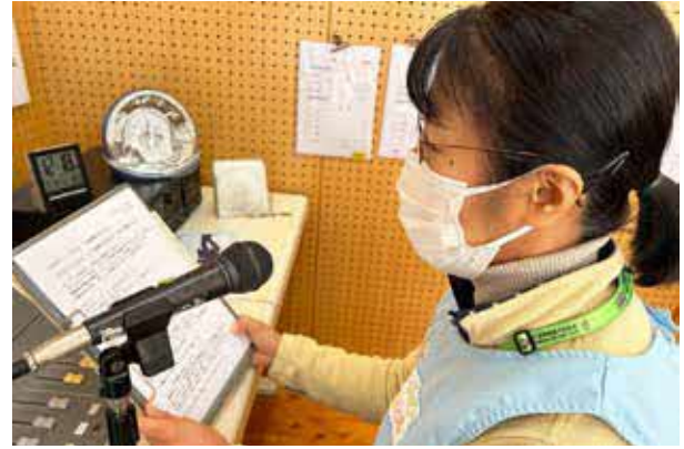
アメリカの郷土料理を提供。栄養教諭による校内放送での献立の説明も行われた。(都城市立明道小学校)