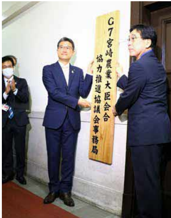
事務局の看板を設置する河野知事、帖佐副市長