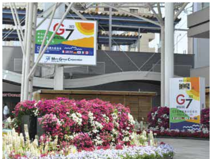
デジタルサイネージとカウントダウンボード (宮崎駅前アミュひろば)