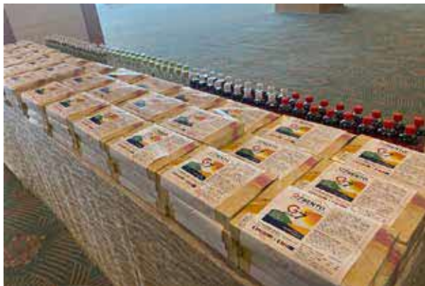
弁当のラッピングで会合をPR