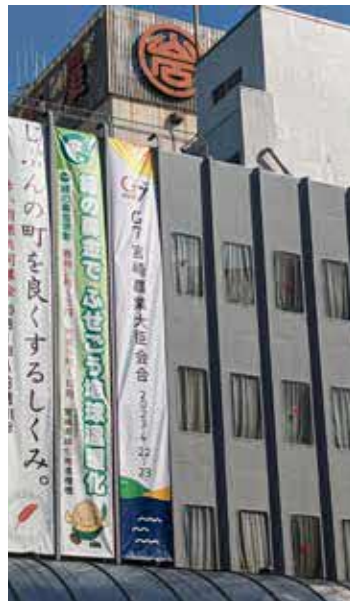
懸垂幕(宮崎山形屋)