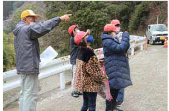
農業者へ取材を行う子ども記者たち