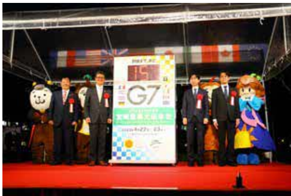
カウントダウンボード除幕式