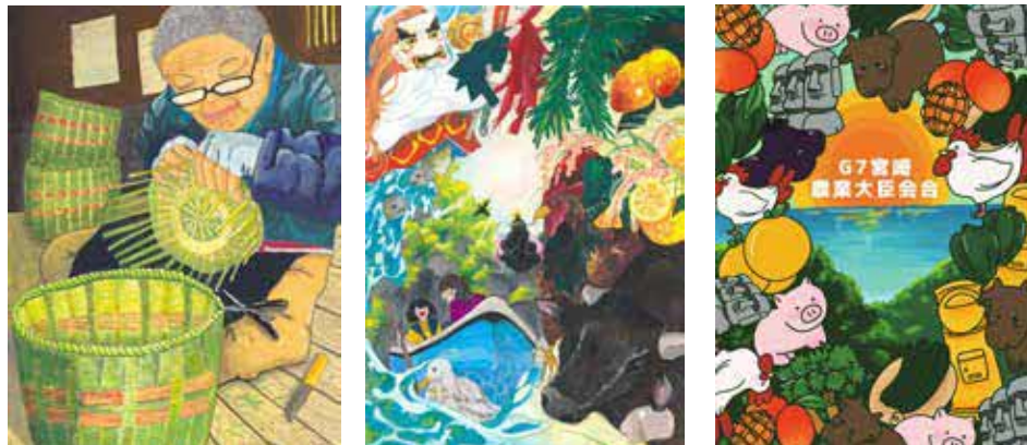
最優秀賞作品(左から小学生の部、中学生の部、高校生の部(ポスター))