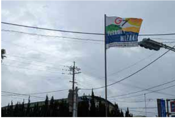
フラッグ(宮崎空港～会合会場)