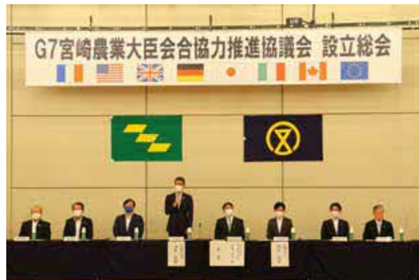
河野知事による設立のあいさつ