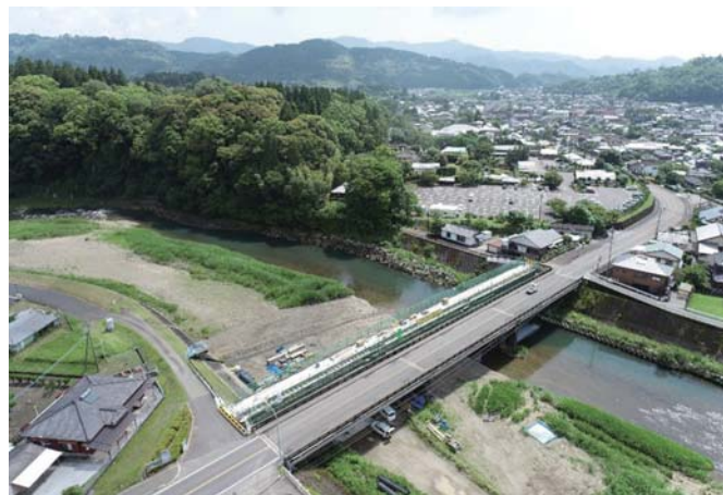
元狩倉日南線 城之下橋側道橋