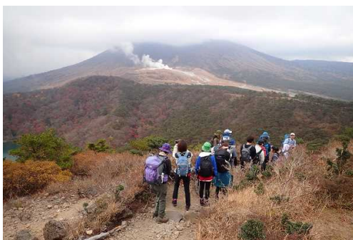
みやざきの自然公園満喫プロジェクト推進事業（初心者登山教室）