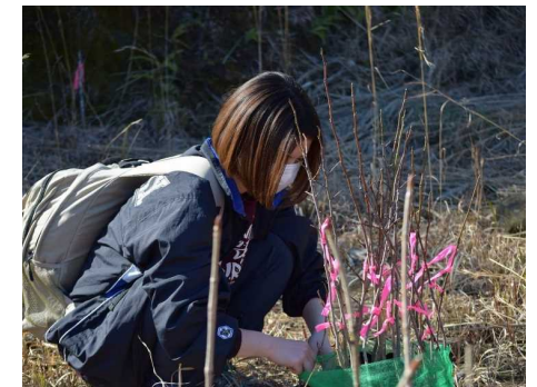
森林ボランティア団体による森林づくり活動