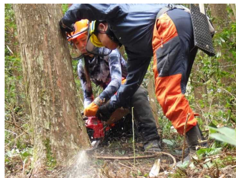
みやざき林業大学長期課程（主伐実習）