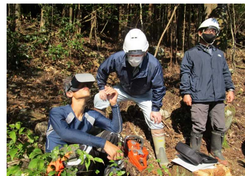
VRを活用した疑似体験