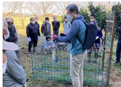
わな捕獲技術向上講習会