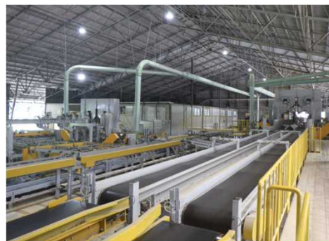
木材加工流通施設整備 (中大径材加工施設)