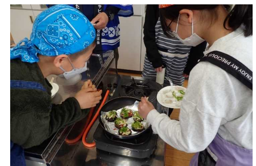
乾しいたけの食育講座 北浦小学校外3小中学校