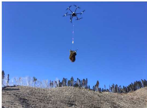
運搬用ドローンによる 苗木運搬