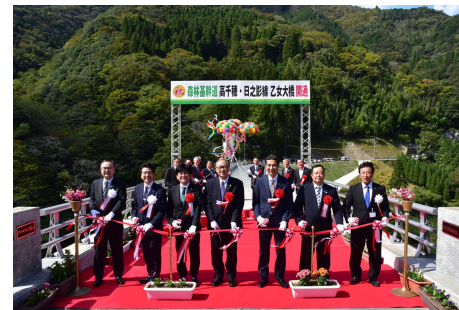
森林基幹道 高千穂・日之影線 乙女大橋開通