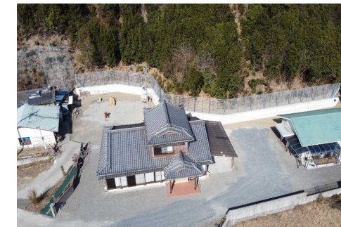
令和4年度予防治山事業 家田地区(延岡市)