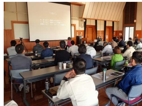
みやざき木造塾2022の開催