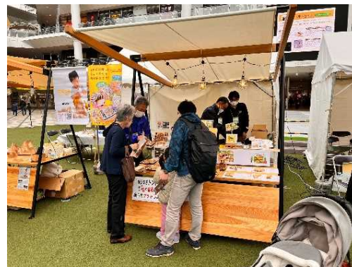
(川崎市木材イベント出展)