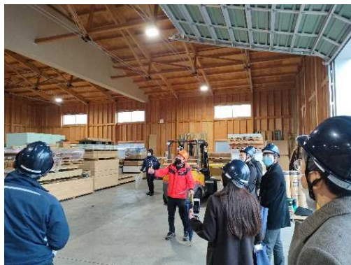
(産地見学会の開催)