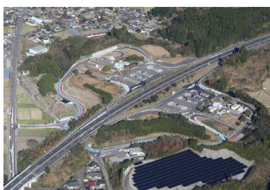
山之ロスマートIC (フル) 供用: H28.9.24