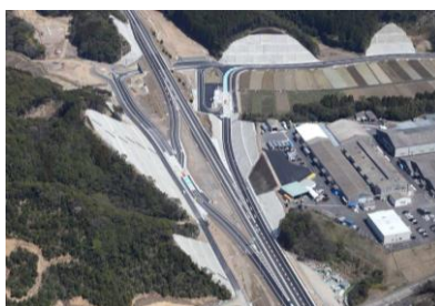
門川南スマートIC (ハーフ) 供用: H29.3.25