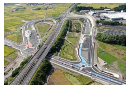
国富スマートIC (フル) 供用: R1.10.6