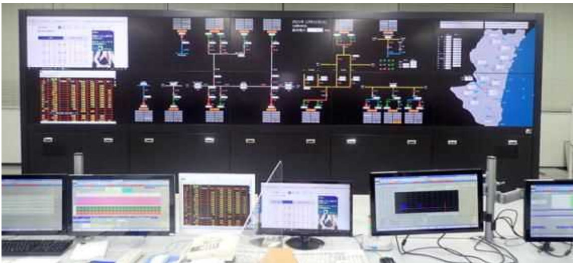
総合監視盤・監視操作卓