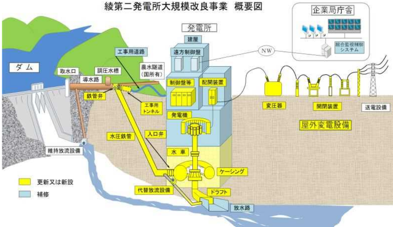
綾第二発電所大規模改良事業 概要図