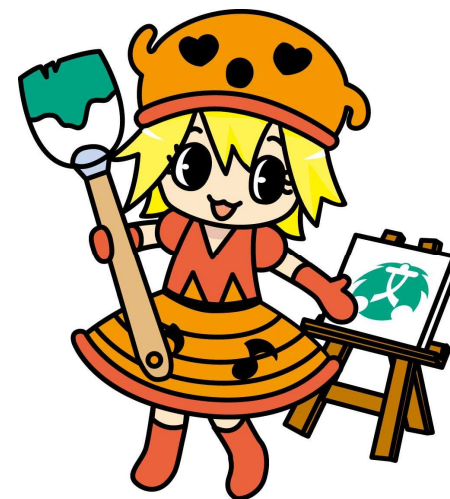
ハニア 宮崎県高文連マスコット

※フェスティバル部門：以下の各部門については、発表のみで順位はつかない。 合唱、美術、吹奏楽、器楽・管弦楽、文芸、M&B、ボランティア(協賛部門)