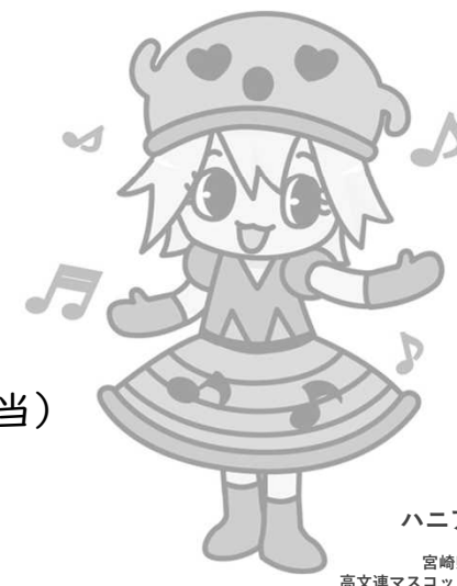
ハニア 宮崎県 高文連マスコット