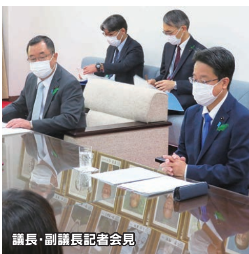
議長・副議長記者会見

また、監査委員として議員2名を選任する知事提出議案に同意しました(議会構成の詳細は、2面・3面をご覧ください)。