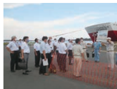
昨年度の常任委員会現地調査 (宮崎カーフェリー)