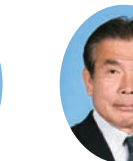
委員 はますな まもる 濱砂 守 宮崎県議会自由民主党 西部市・西米良村選出