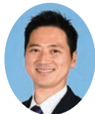
委員長 にしむら さとし 西村 賢 宮崎県議会自由民主党 日向市選出