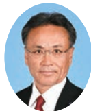
副委員長 ひだか としお 日高 利夫 宮崎県議会自由民主党 東諸県郡選出