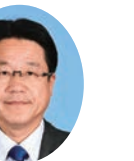
委員 やました ひろみ 山下 博三 宮崎県議会自由民主党 都城市選出