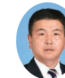
副委員長 さかもと やすろう 坂本 康郎 公明党宮崎県議団 宮崎市選出