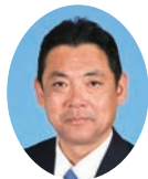
委員長 ひだか ひろゆき 日高 博之 宮崎県議会自由民主党 日向市選出