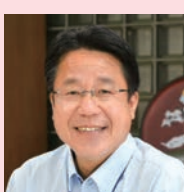
副議長 みすもと たかひろ 右松 隆央 宮崎県議会自由民主党 宮崎市選出

今後とも、県民の皆様の様々な声に真摯に耳を傾けながら、信頼され、期待される議会を目指すとともに、元気で活力のあふれる郷土づくりに全力を尽くしてまいりますので、一層の御理解と御協力をお願い申し上げます。