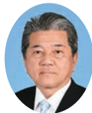
委員 とやま まもる 外山 衛 宮崎県議会自由民主党 日南市選出