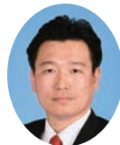
委員 ふた み やすゆき 二見 康之 宮崎県議会自由民主党 都城市選出