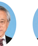
委員 みぎまつ たかひろ 右松 隆央 宮崎県議会自由民主党 宮崎市選出