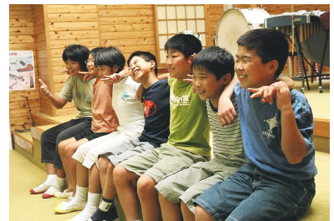
桑野内小学校の最後の生徒となる7人