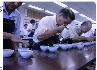
出品茶の審査風景（九州茶品評会）