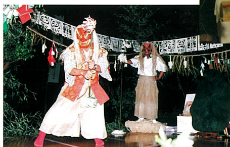
神楽に初挑戦する参加者