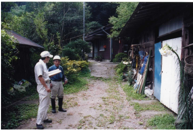
地域住民の方からの聞き取り調査