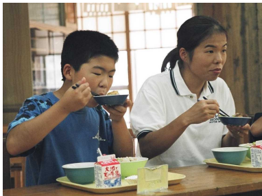
この日は、保護者も参加して、地取れ野菜がいっぱい入った学校給食を楽しんだ。

ま食学るくす小かで学 業食解の 材校五り今。中ら、校今に「し農県 ののケの回 学11西を年取みて業で 日学瀬指は、校月日対度りやもやは、 「校町針、29か管に、んきお産子 の給かと地 校け内実県で食う物供 様食ら位産 校をてで施内材とのた 子「置地 校をてで施内材とのた をみ桑づ消 校をてで施内材とのた 紹や野けを 校をてで施内材とのた 介ざ内て町 校をてで施内材とのた しき小いづ 校をてで施内材とのた