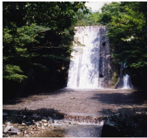
既設砂防ダムの状況

上流域に小規模な崩壊が見られる渓流もあったことから、これらの崩壊が下流域にどのような影響を与えるのかを引き続き調査していきます。また、現在は危険でなくても今後崩壊の恐れのある箇所を把握するため、今後、管内の細かな調査を行うなど防災対策に取り組んでいきます。