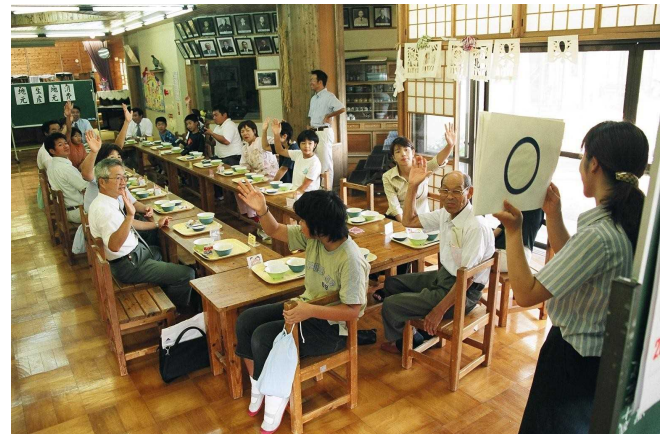
地産地消や食材についてのクイズに答える生徒と保護者たち