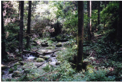
土石流危険渓流の状況

調査はまず、地域住民への聞き取りを行い、既設砂防ダム状況を確認し、流域内の荒廃状況の確認作業を行いました。