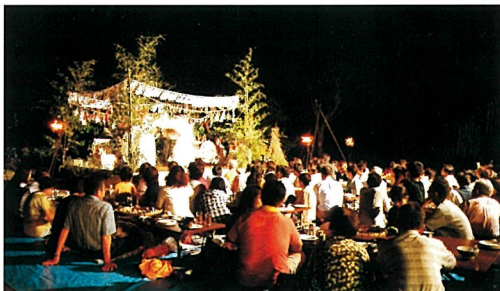
屋外での神楽を楽しむ参加者