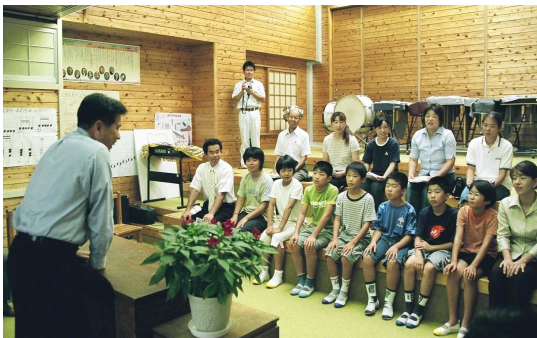
飯干五ヶ瀬町長の話を熱心に聞く生徒と保護者