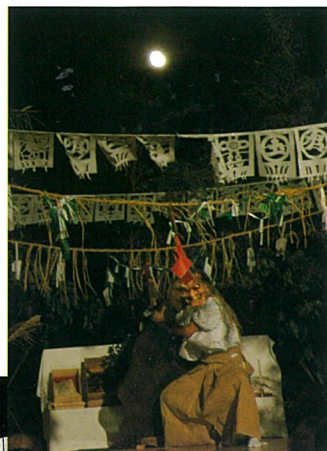
月明かりの下で舞われた勇壮な神楽